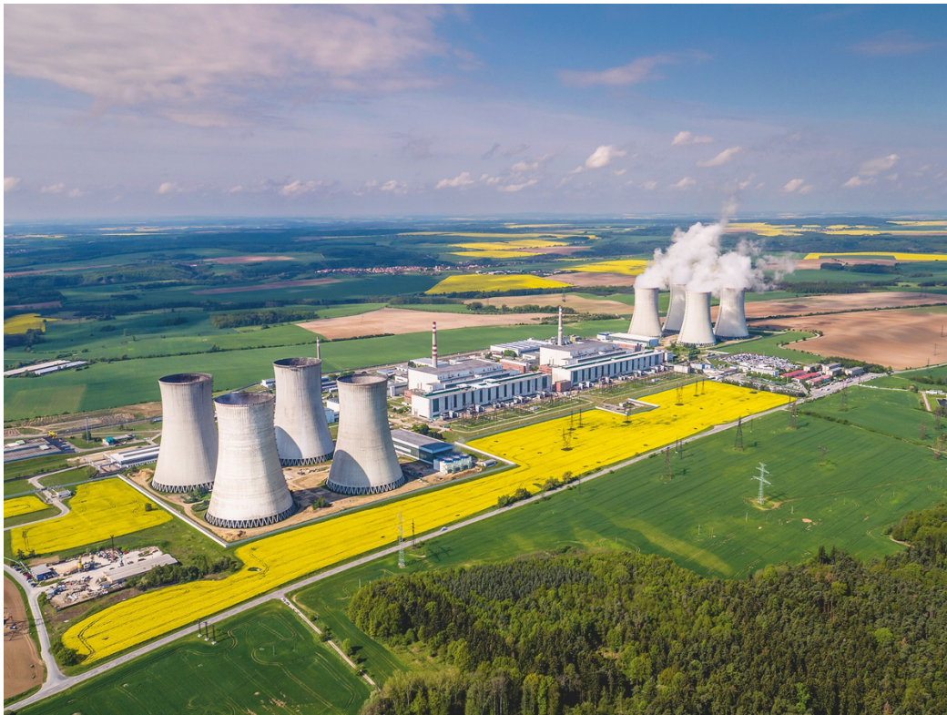
Obrázek 1- [Dukovany]. In: ekonomickydenik.cz [online]. 20.11.2019 [cit. 27.12.2022]. Dostupné z: https://ekonomickydenik.cz/cesi-jednali-bruselu-poprve-dostavbe-jaderneho-bloku-dukovan/

Mezi nejvýznamnější veřejné stavební zakázky, při jejichž realizaci bude možné využít alternativní způsoby řešení sporů prostřednictvím Rady pro spory, budou bezesporu veřejné zakázky společností ČEZ, a.s., na dostavby Jaderné elektrárny Temelín a Jaderné elektrárny Dukovany, o jejichž realizaci se ucházejí zahraniční společnosti: Westinghouse Electric Company (USA), EDF (Francie) a KHNP (Korea). Možností využití Rady pro spory pro dostavbu jaderného bloku elektrárny Dukovany se zabývám v kapitole 7.1.