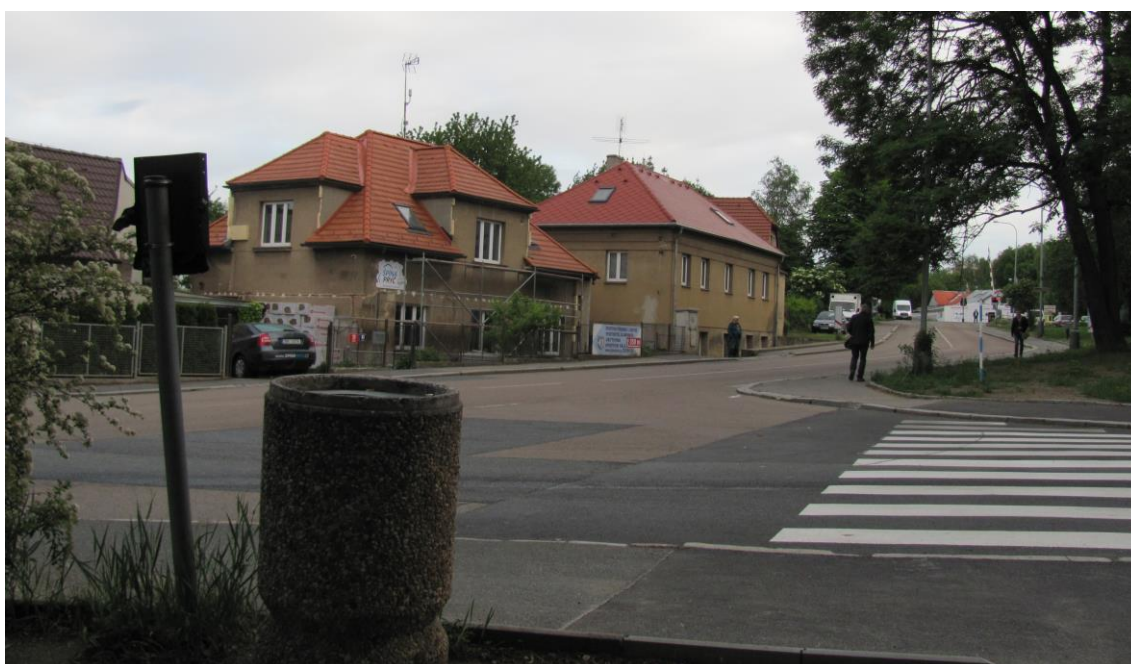
Foto 5.2 Pohled na křižovatku z jihovýchodu