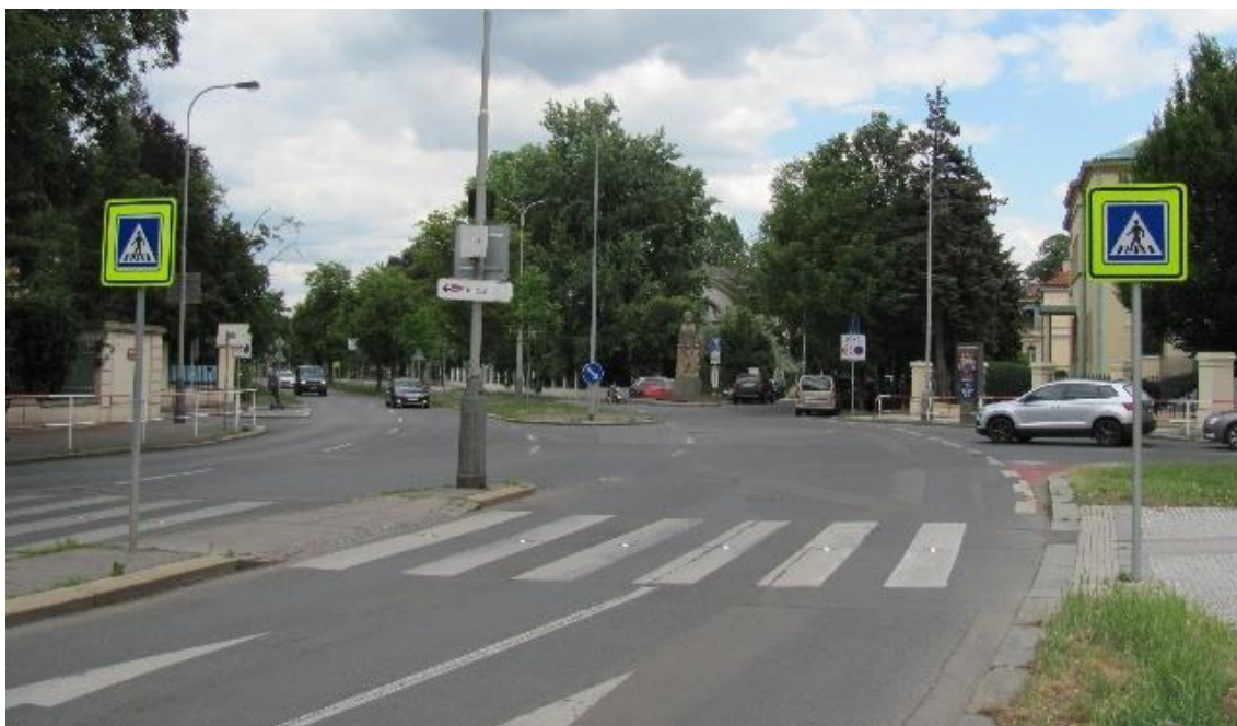
Foto 2.1 Pohled z ulice Jaselská