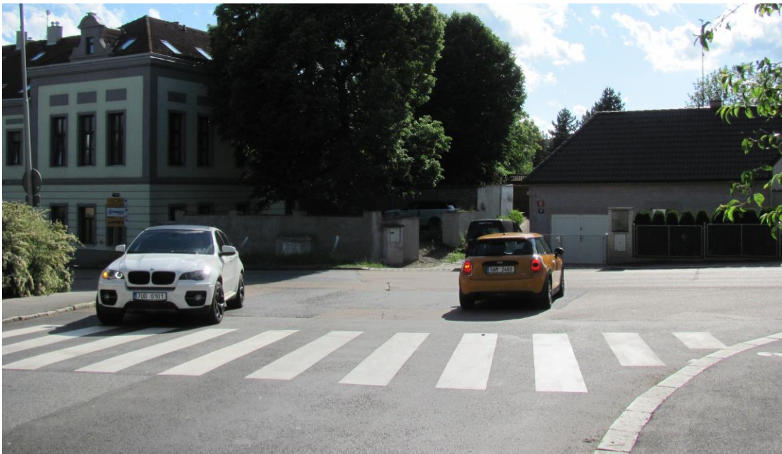
Foto 5.4 Pohled z ulice Stochovská