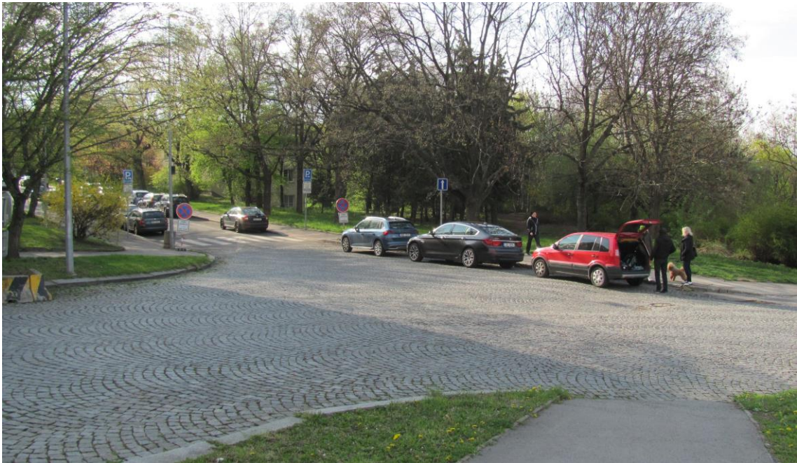
Foto 4.11 Pohled do křižovatky z jihovýchodu