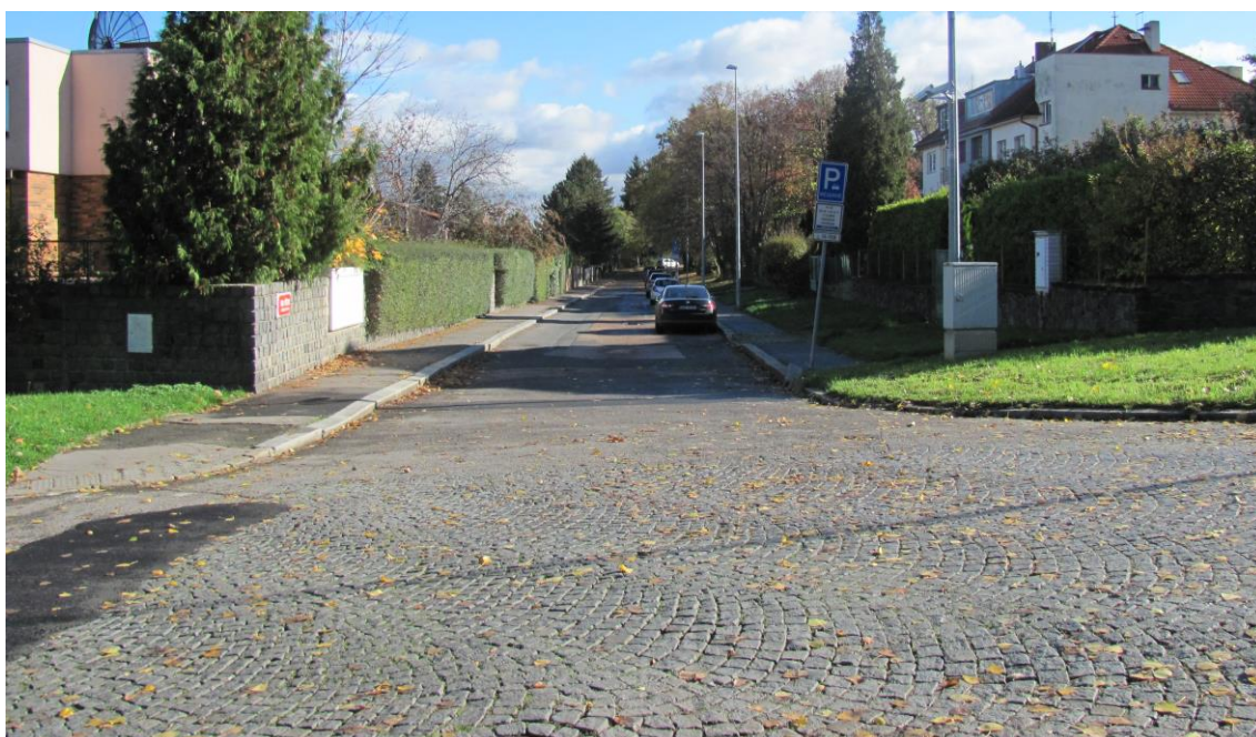
Foto 4.18 Pohled do ulice Na Větru