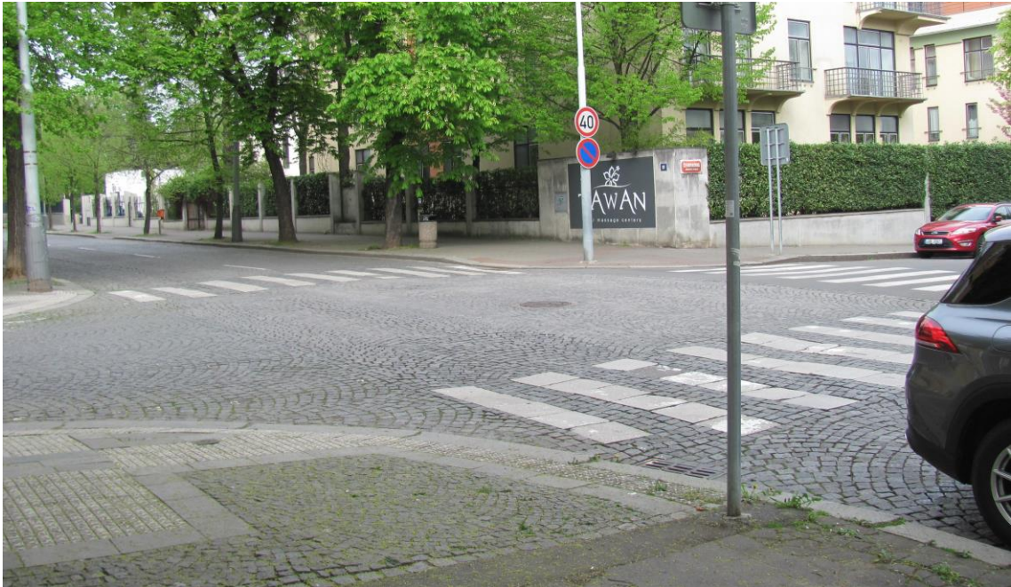
Foto 3.1 Pohled do křižovatky z jihovýchodu