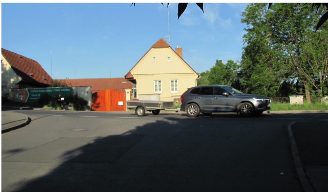
Foto 5.12 Pohled z ulice Staré náměstí