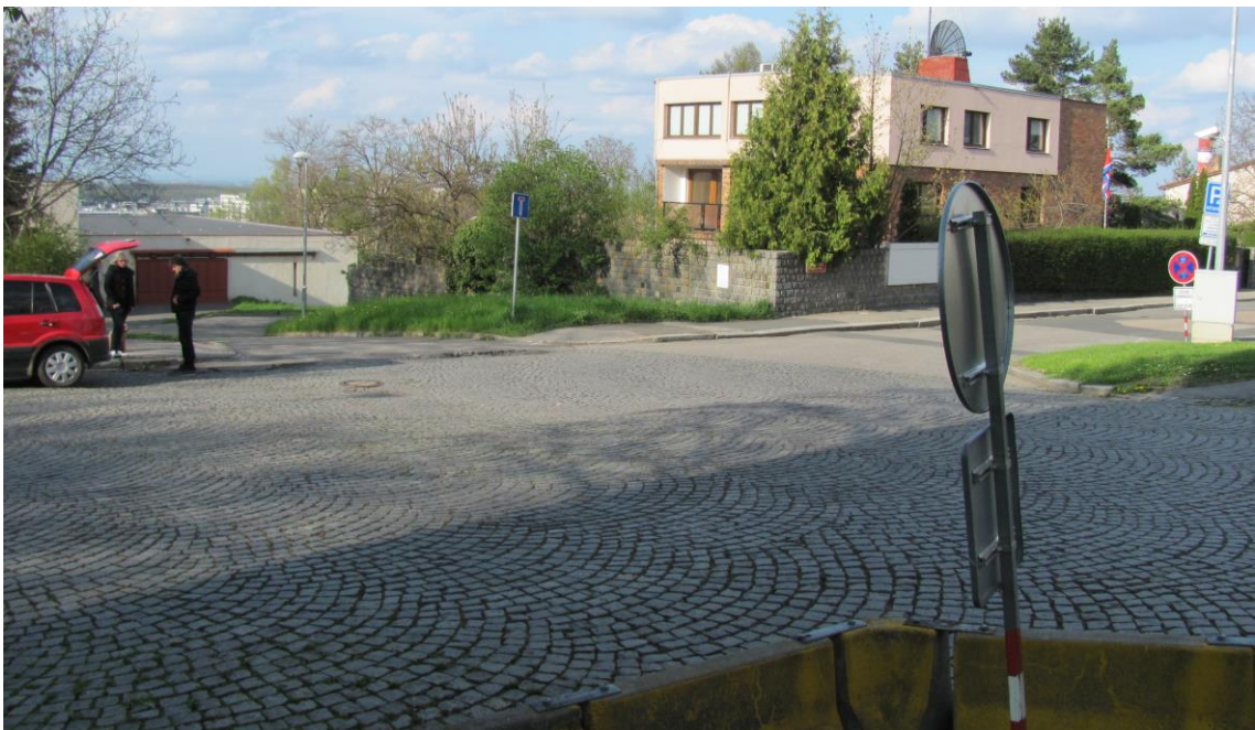
Foto 4.12 Pohled do křižovatky z jihu západu