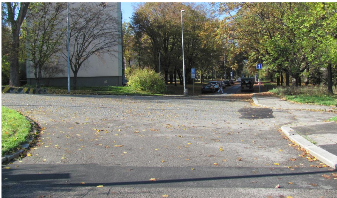
Foto 4.17 Pohled z ulice Na Větru