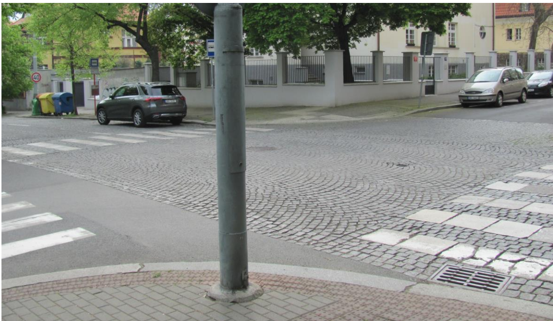
Foto 3.2 Pohled do křižovatky ze severozápadu