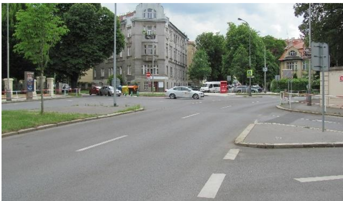
Foto 2.2 Pohled z ulice Pod Kaštany