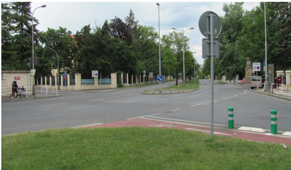
Foto 2.6 Celkový pohled na křižovatku