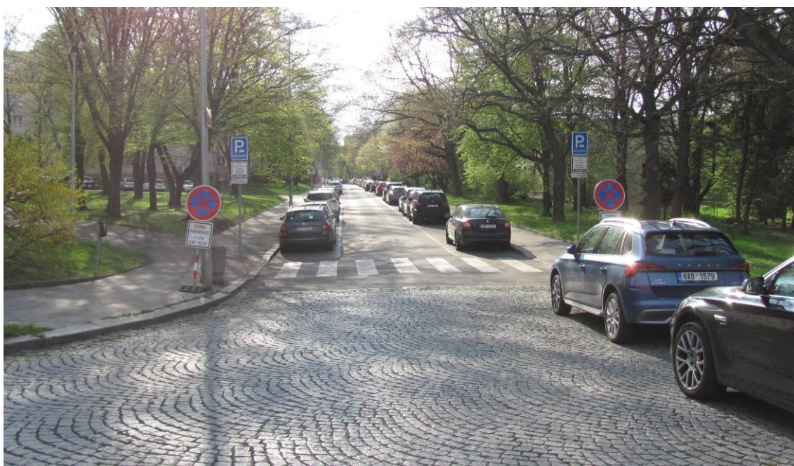
Foto 4.14 Pohled do ulice Na Okraji