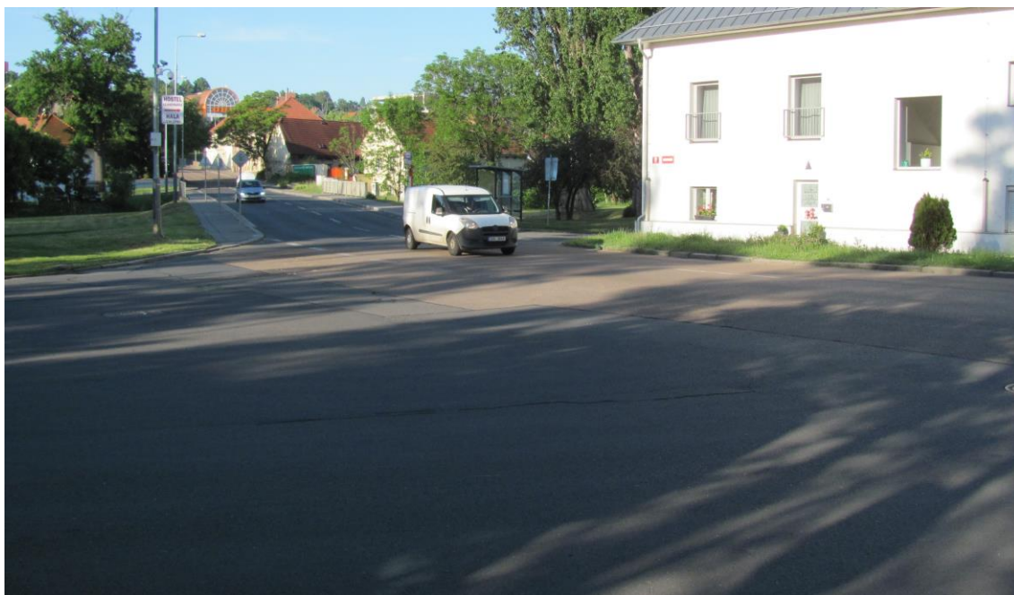
Foto 5.9 Pohled z severní strany ulice Staré náměstí