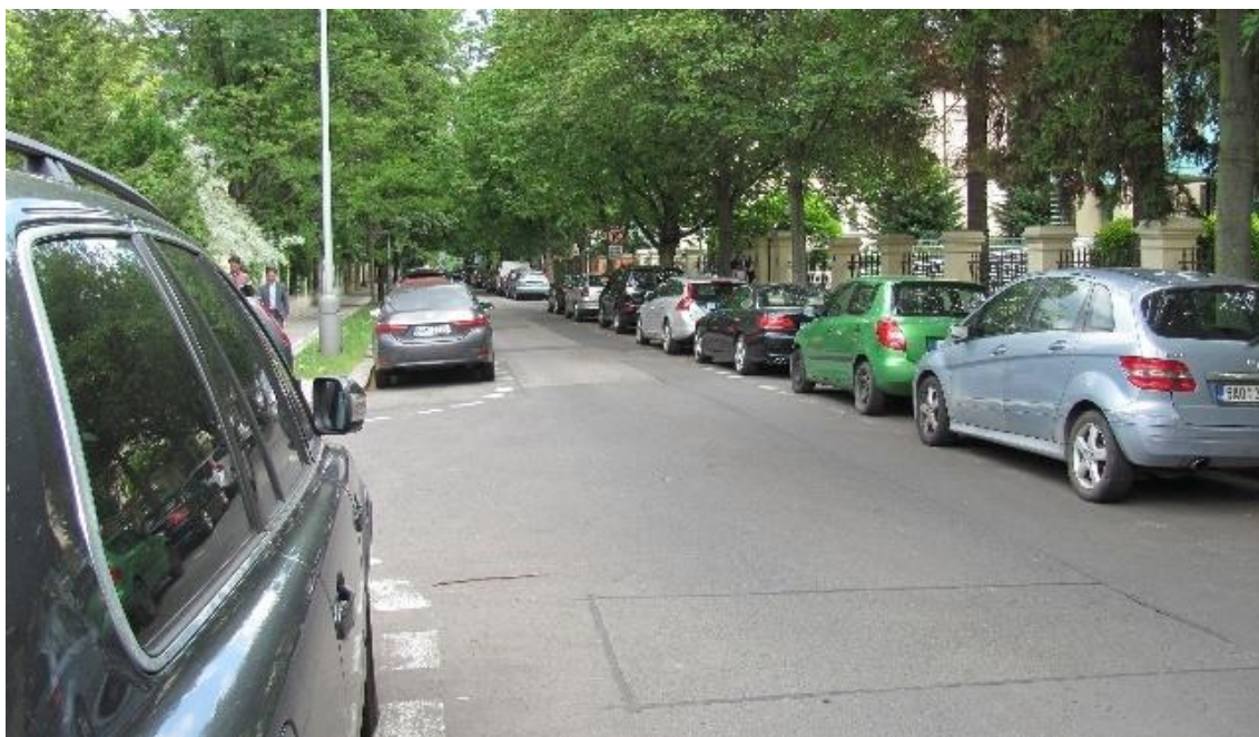
Foto 2.5 Pohled do ulice Na Zátorce