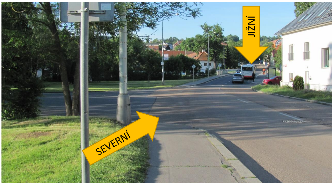
Foto 5.5 Pohled na křižovatky ulic Drnovská, Staré náměstí ze severu