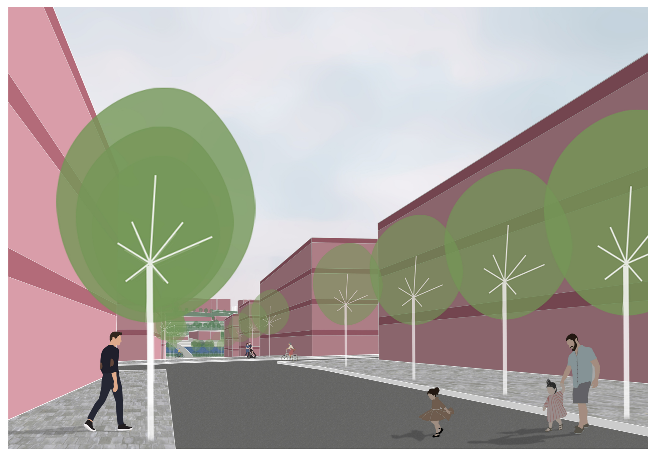
pohled ul. Cyklistickou - v pozadí Městská plovárna