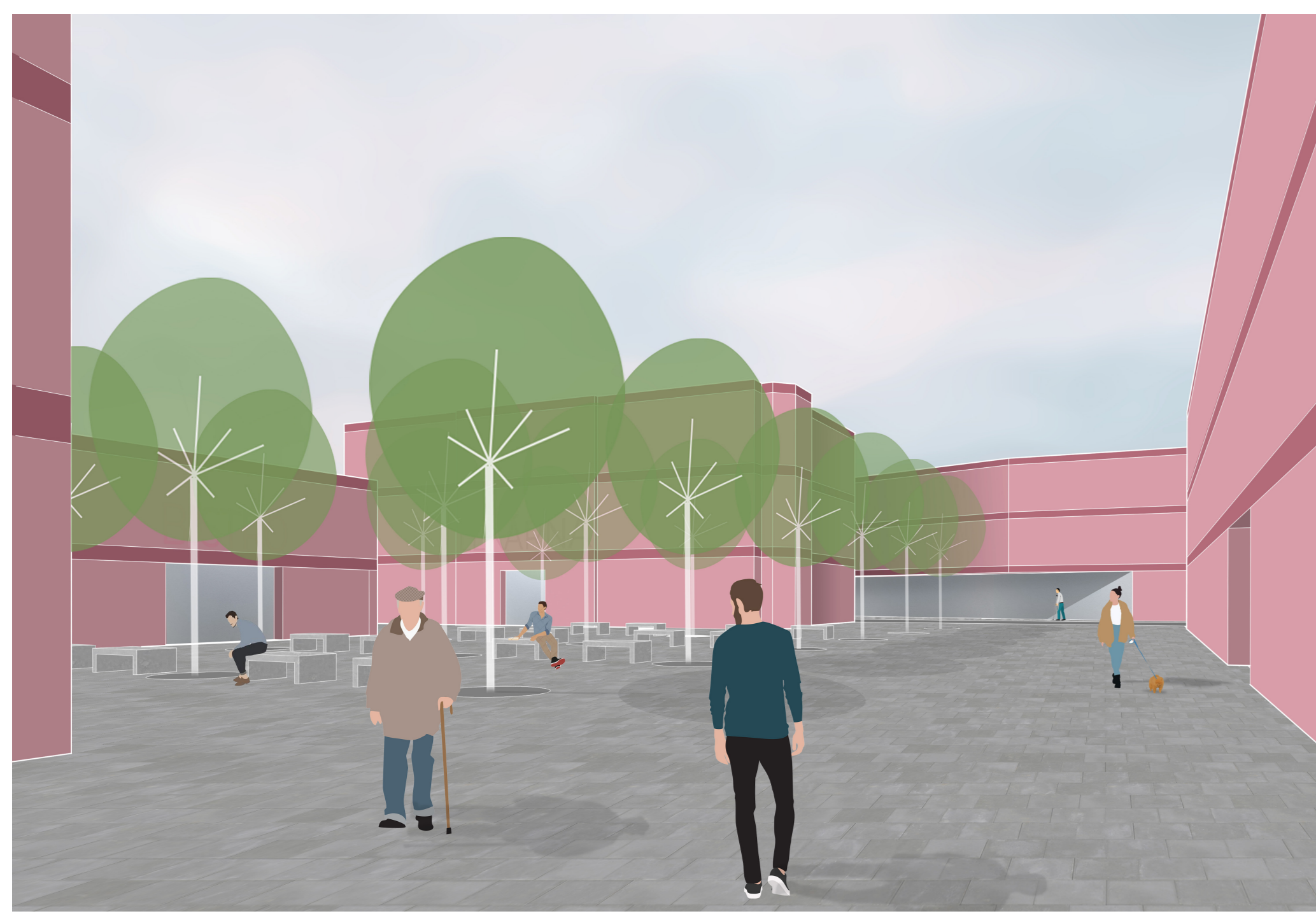
Areál nemocnice - pohled novým centrálním veřejným prostorem