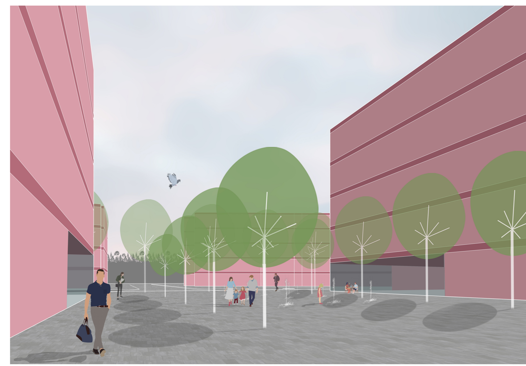
pohled k areálu ETD