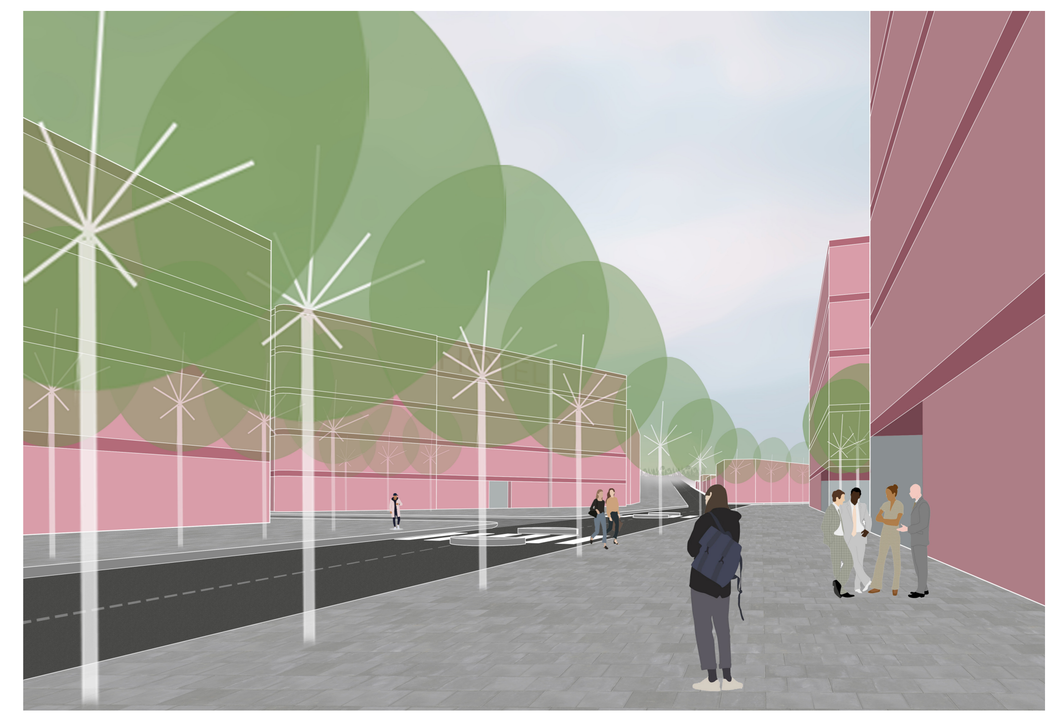
pohled ul. Zborovskou