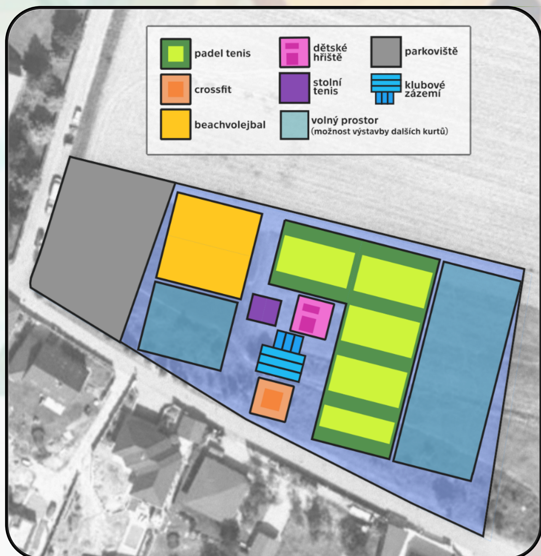
Znalost padelu napříč generacemi

The master thesis deals with the preparation of a feasibility study for the construction of a sports complex with a focus on sport padel. The aim of the thesis is to develop a feasibility study and then to evaluate the suitability of the construction of a sport complex. In terms of structure, the thesis is divided into two parts. The opening theoretical part contains two chapters. The first one is devoted to project management. The second chapter describes the individual parts of the feasibility study. The practical part is also divided into two chapters. First, the sport padel is introduced and then the feasibility study chapter is elaborated. From the quantitative questionnaire survey carried out, then using PEST and SWOT analysis and Porter's five forces model, a suitable strategy for the SPORT PADELES complex is proposed. The investment is evaluated based on the observed values of the economic indicators NPV, payback period and IRR.