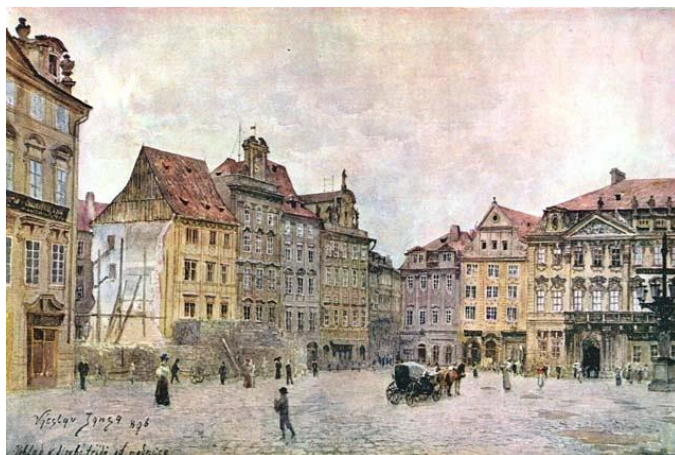
2. Praha, severní strana Staroměstského náměstí s původními domy čp. 931–933/I, Václav Jansa, 1896.