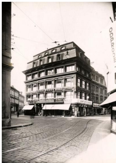
8. Praha, Gočárův kubistický dům U černé Matky Boží z roku 1912, dobový snímek. Ústav dějin umění AV ČR, odd. dokumentace, sbírka historické fotografie, inv. č. 018872.