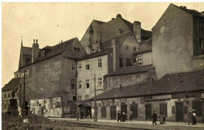
1. Praha, vyústění Karmelitské ulice do Malostranského náměstí po vytvoření průlomu U Klíčů, kolem 1905. Ústav dějin umění AV ČR, odd. dokumentace, sbírka historické fotografie, inv. č. 009806.