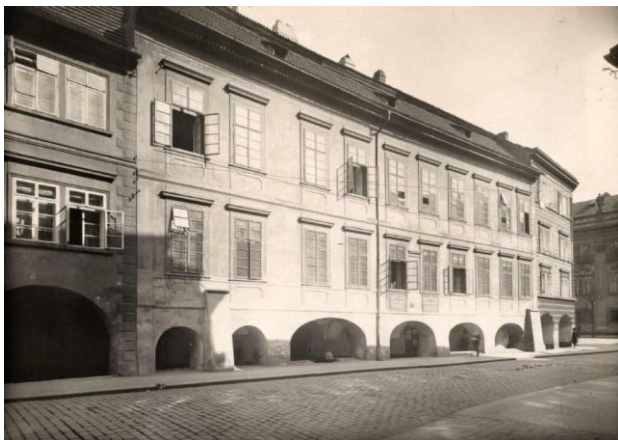
7. Praha, hlavní průčelí paláce Straků z Nedabylic čp. 476/III do Maltézského náměstí, počátek 20. století. Ústav dějin umění AV ČR, odd. dokumentace, sbírka historické fotografie, inv. č. 011111.