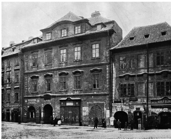
3. Praha, dům čp. 16/I před bouráním, před 1908. CHYTIL, Karel – HILBERT, Kamil. Dům Andělské koleje na Starém městě (č. p. 16 n. 1.). Zprávy komise pro soupis stavebních, uměleckých a historických památek král. hlav. města Prahy IV , 1912, s. 41.