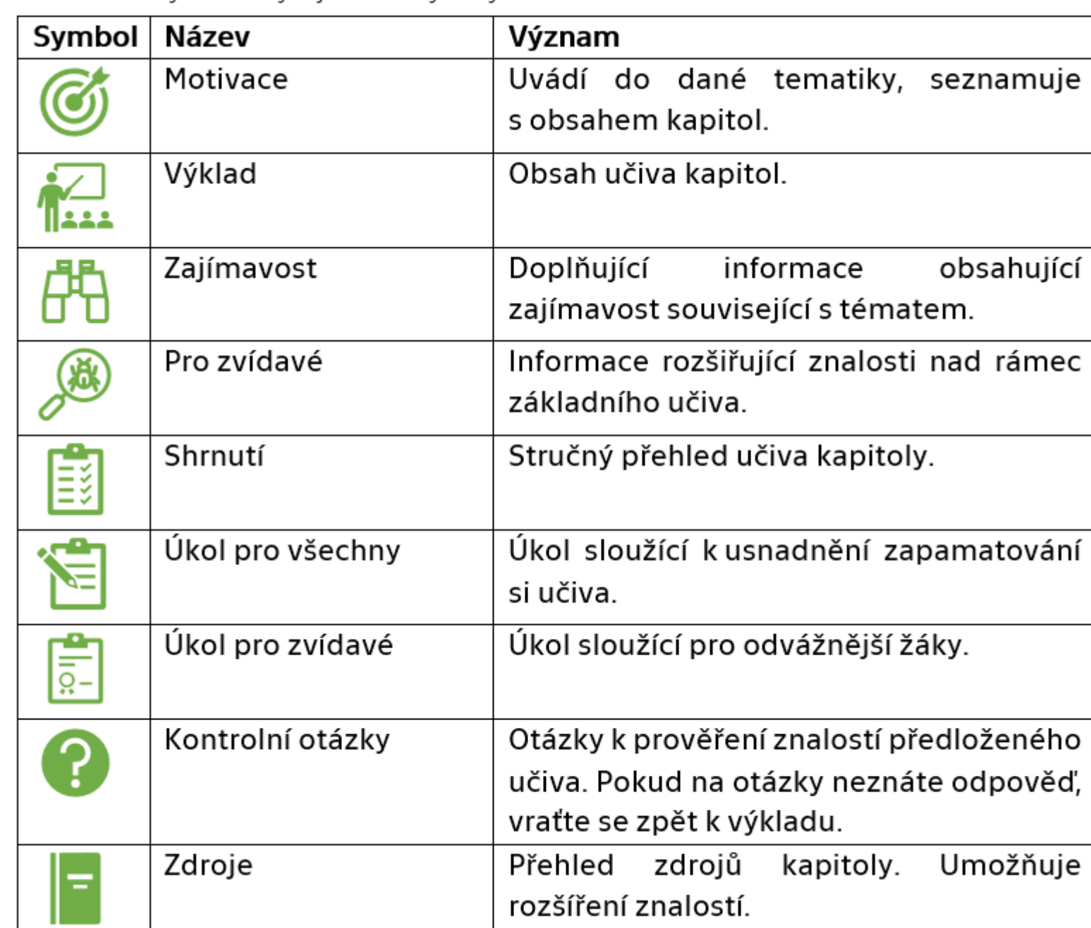
Tabulka 5: Vysvětlivky k jednotlivým symbolům v textu

Cílem bakalářské práce „Soubor učebních textů pro výuku odborného předmětu na středních technických školách“ je vytvoření souboru učebních textů. Teoretická část je věnována obecným nárokům a východiskům tvorby učebních textů. V praktické části vycházející z teoretické byl navržen soubor učebních textů s názvem „Místní komunikace“. Tento text slouží jako úvod do dané problematiky a je zaměřen na témata kategorie místních komunikací, návrhové prvky místních komunikací, vozovky a chodníky, odvodnění a inženýrské sítě.