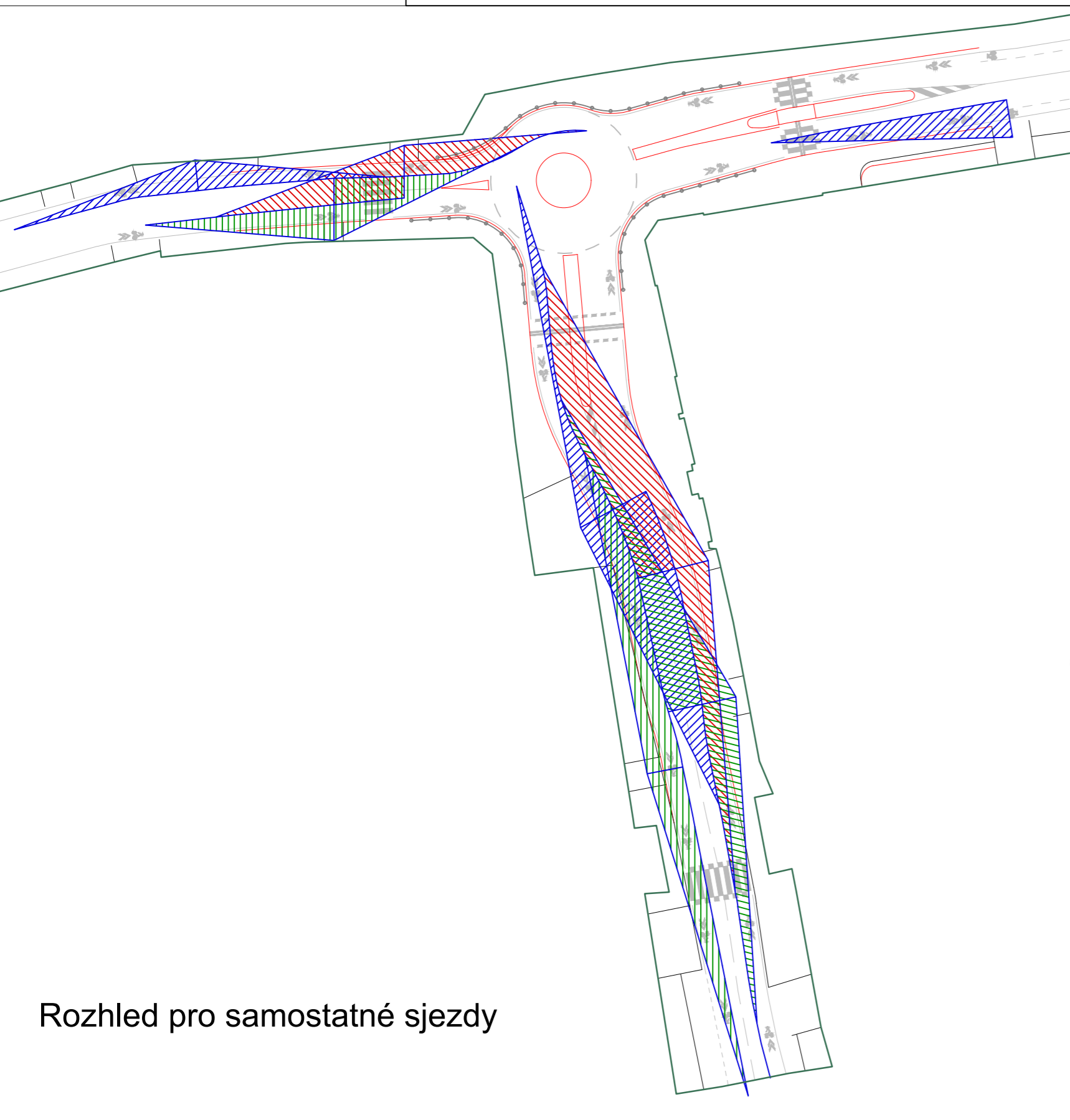
Rozhled pro samostatné sjezdy