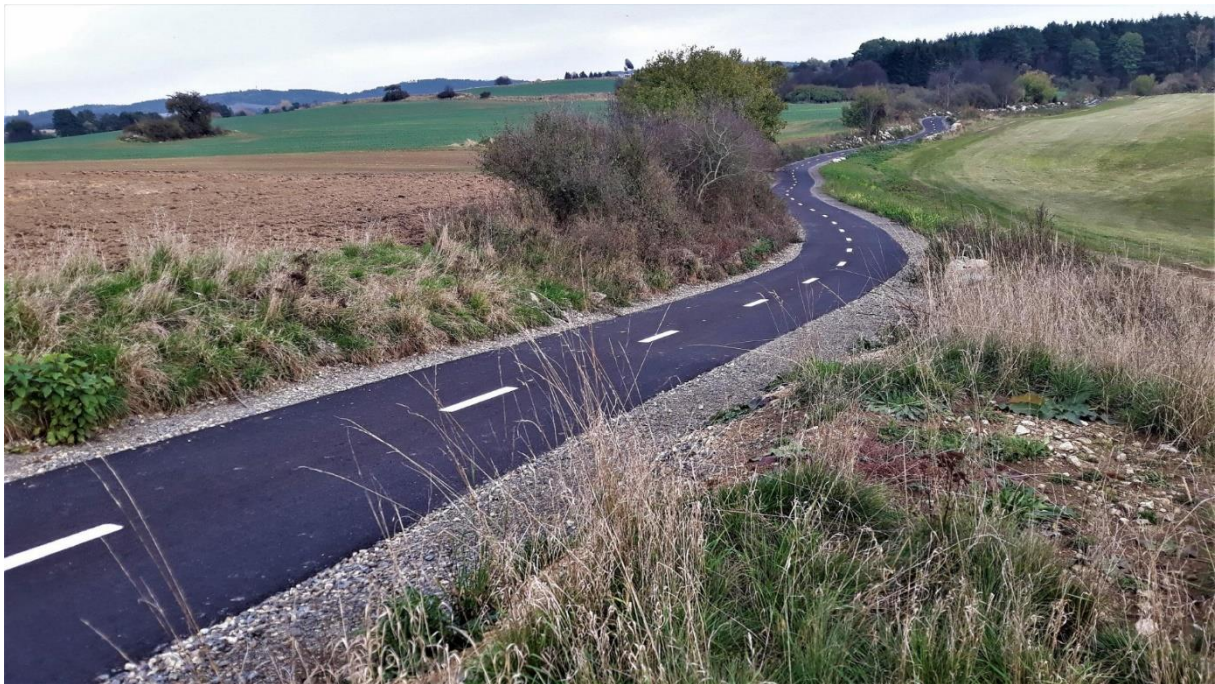
Obrázek 38: Krčínova Cyklostezka, Sedlčany [17]