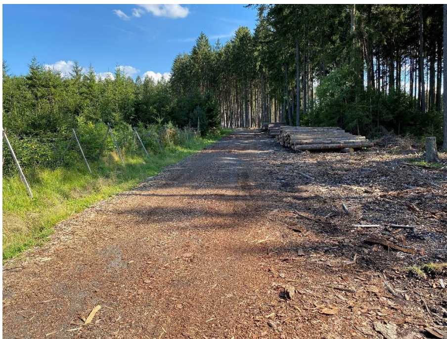
Obrázek 27: Lesní cesta 330997363 směrem Kamenná Lhota [37]