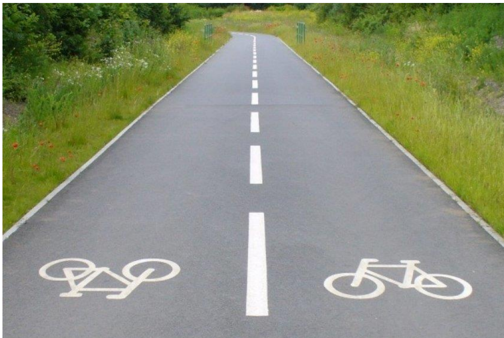
Obrázek 60: Cyklostezka Ostravsko [29]