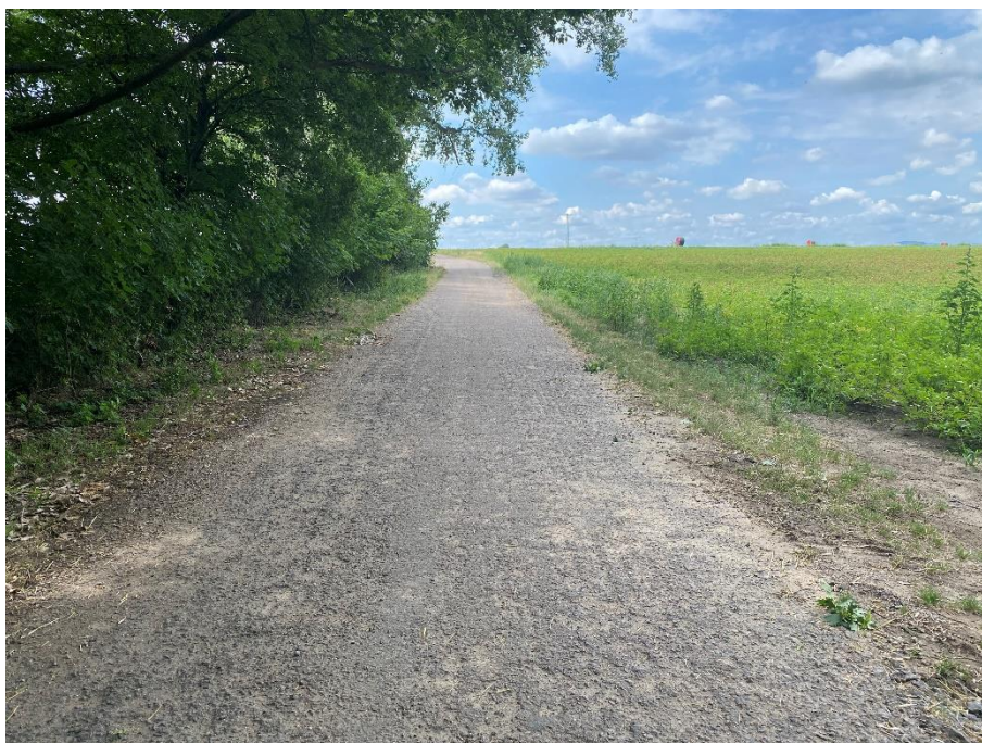
Obrázek 51: Polní cesta 232465138 směrem Církvice [37]