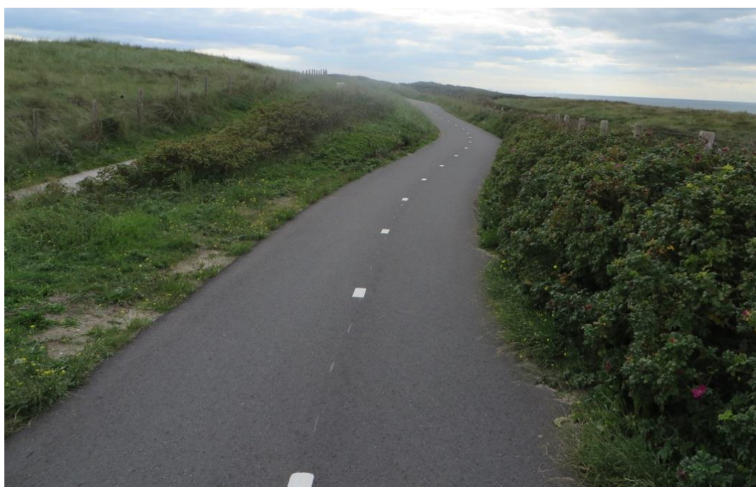
Obrázek 54: Cyklostezka, Nizozemsko [25]