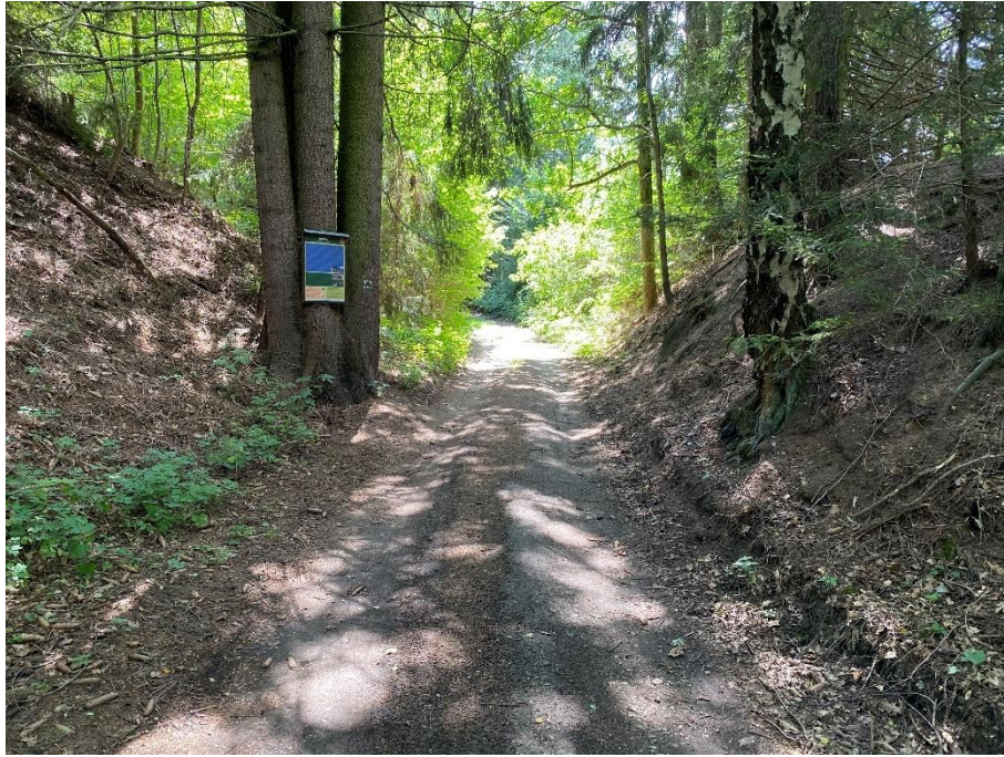
Obrázek 21: Lesní cesta 479236663 směrem Bělá [37]