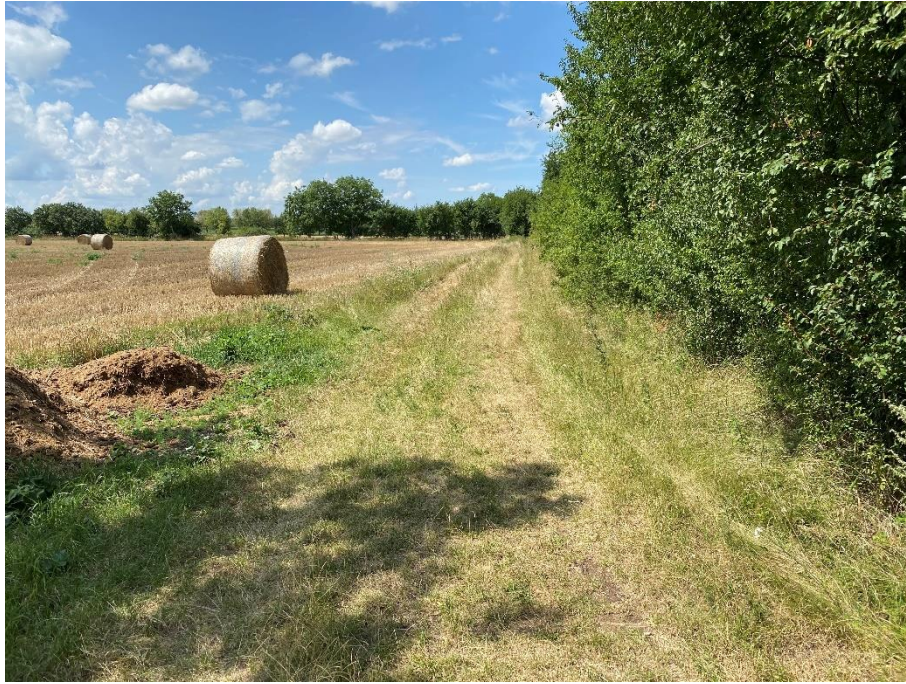
Obrázek 59: Polní cesta 1019804821 směrem Poličany [37]