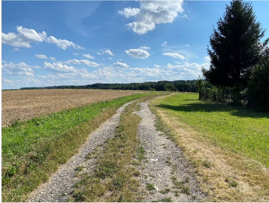
Obrázek 29: Polní cesta 315511137 směrem Žandov [37]