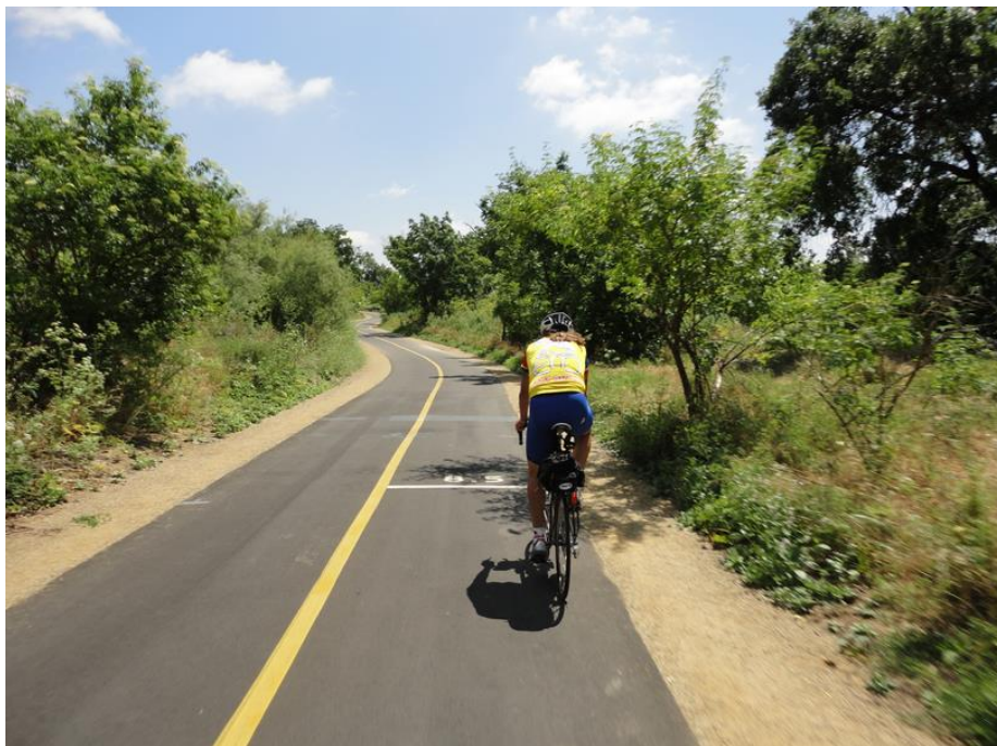
Obrázek 4: Cyklostezka American River Bike Trail, Sacramento, USA [2]