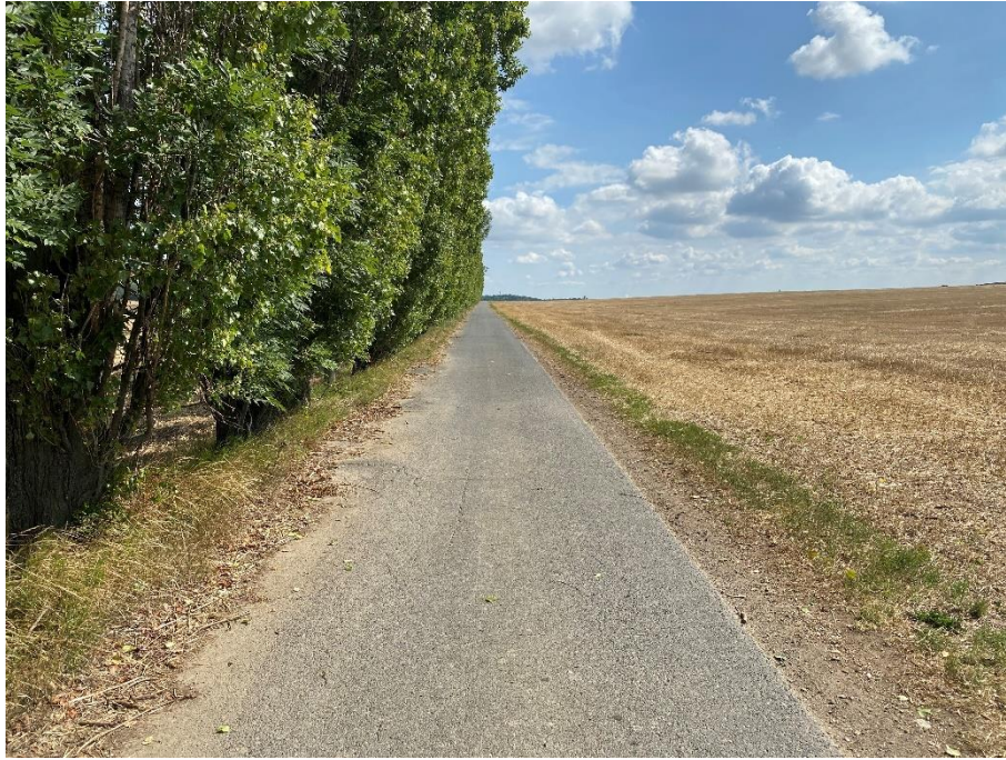
Obrázek 9: Polní cesta 169157372 směrem od obce Přítoky [37]