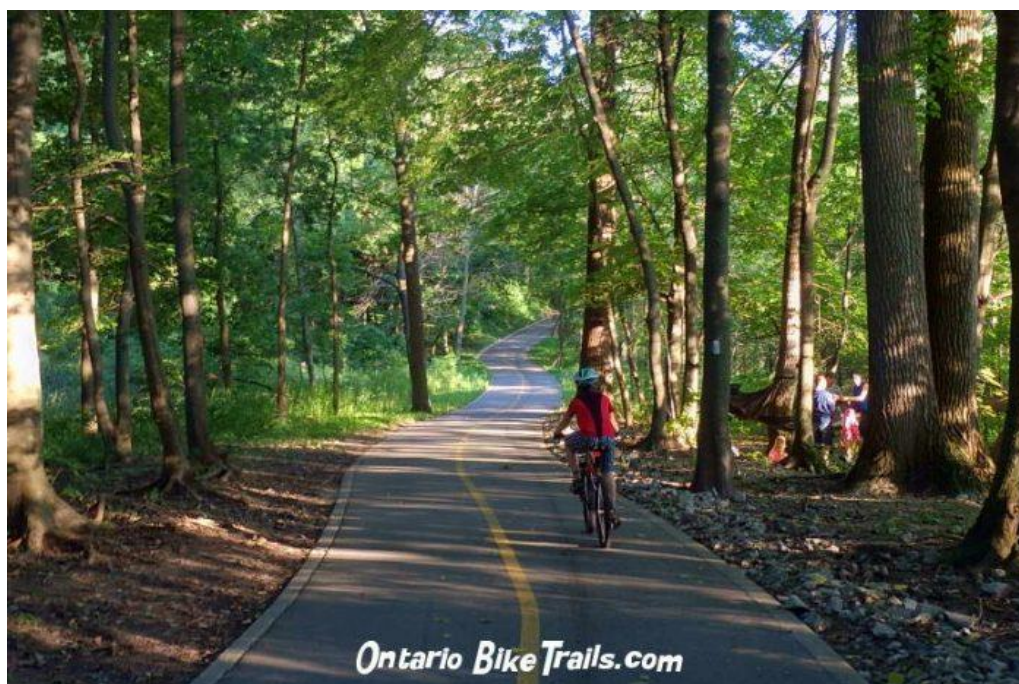
Obrázek 6: Cyklostezka Thames Valley, Ontario, USA [3]