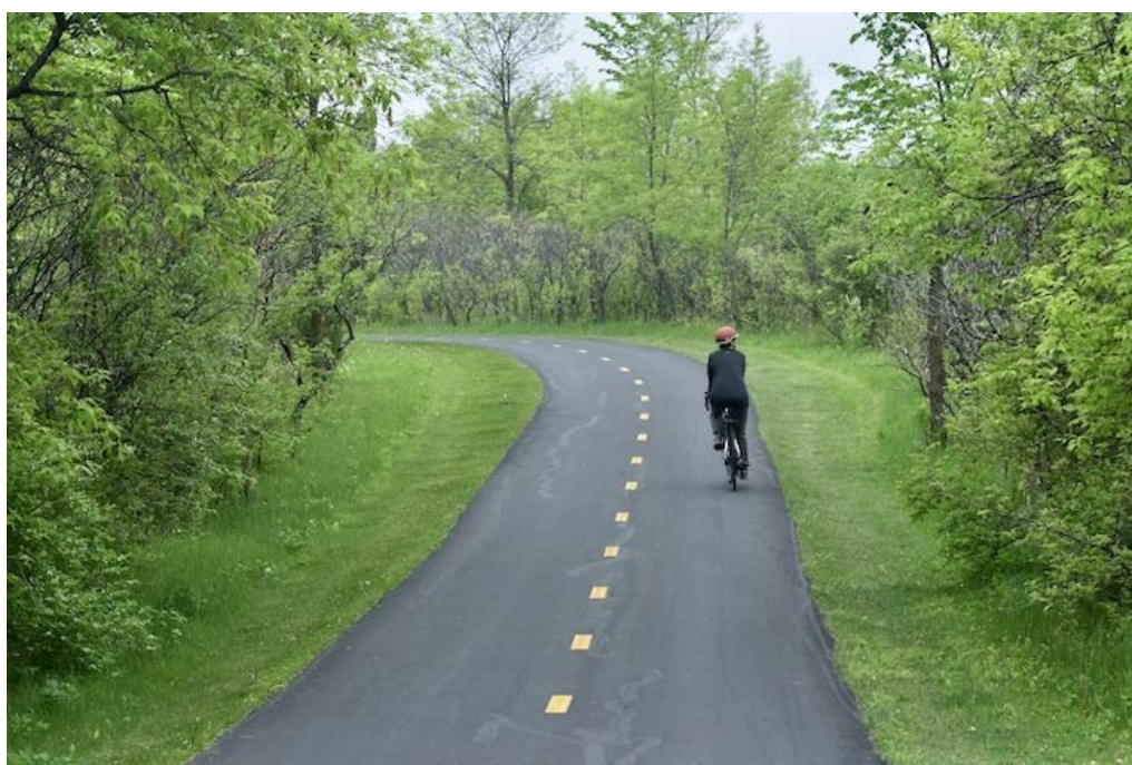
Obrázek 62: Cyklostezka, Minnesota, USA [36]