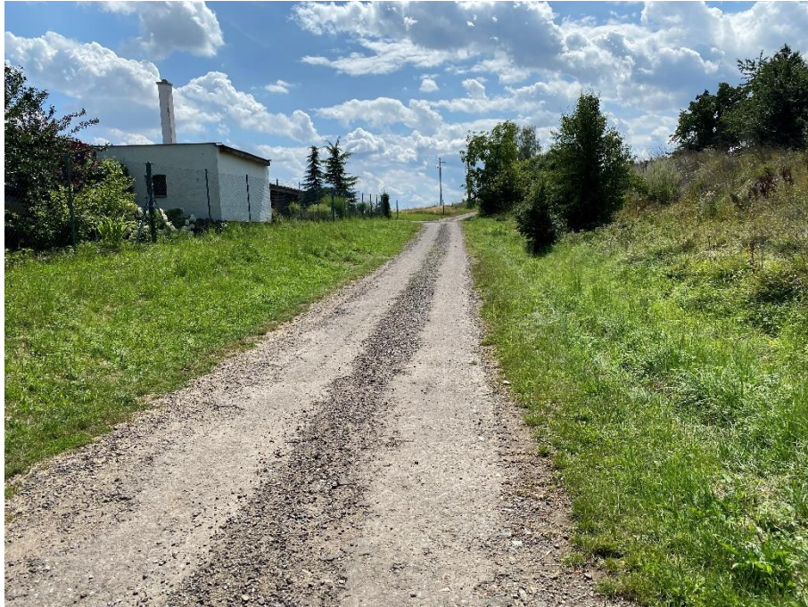
Obrázek 45: Polní cesta 56042749 směrem Březová [37]