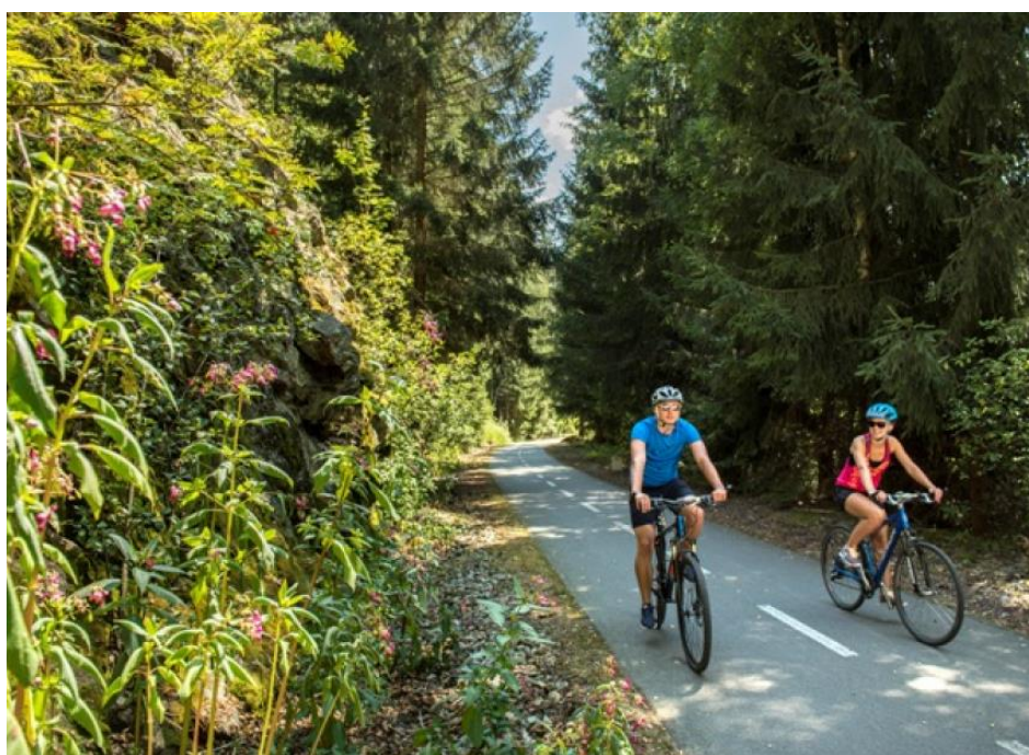
Obrázek 12: Cyklostezka Příbyslav – Sázava [9]