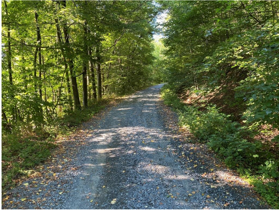
Obrázek 35: Lesní cesta 287782511 směrem Petrovice II [37]