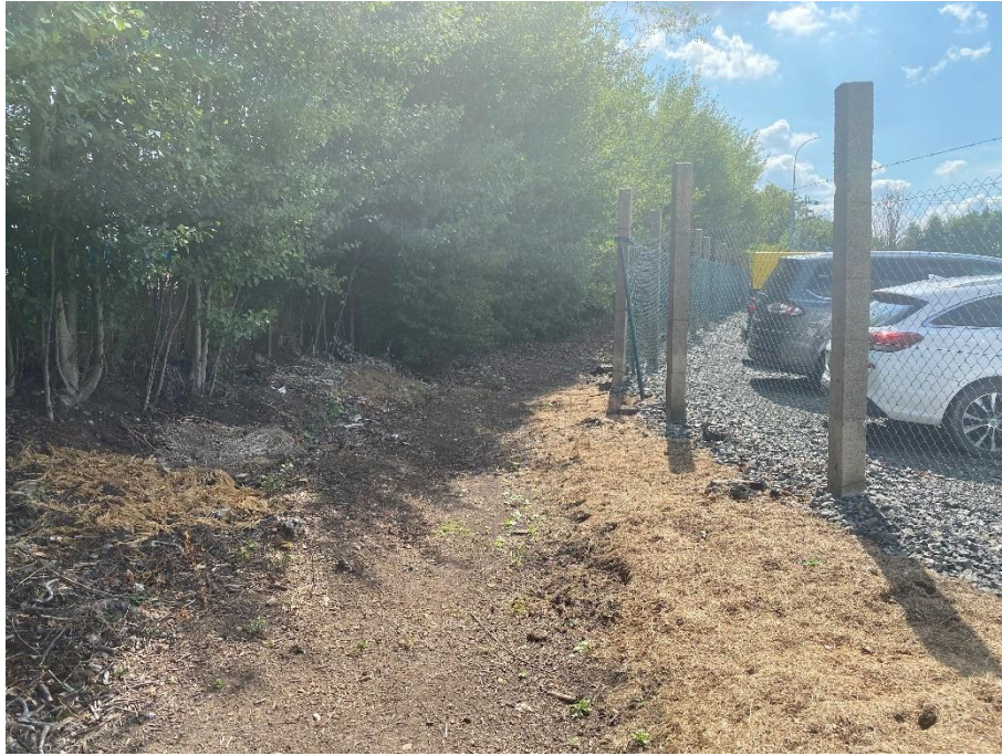
Obrázek 75: Polní cesta 406546493 směrem řeka Vrchlice [37]