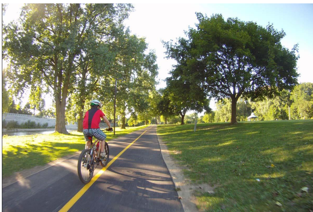
Obrázek 16: Cyklostezka Thames Valley, Ontario, USA [3]