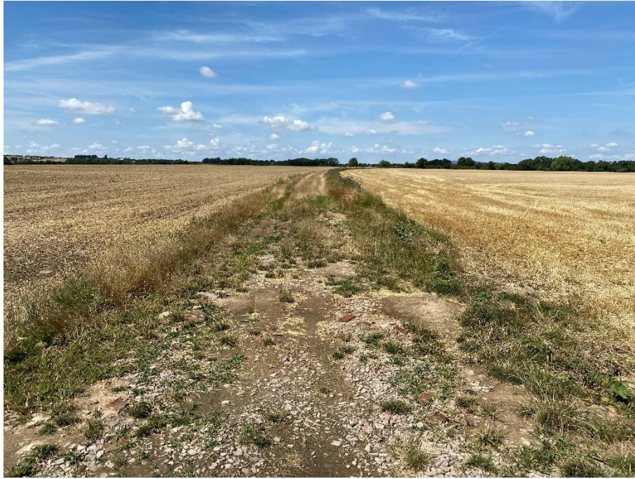
Obrázek 7: Polní cesta 44977979 směrem Nová Lhota [37]