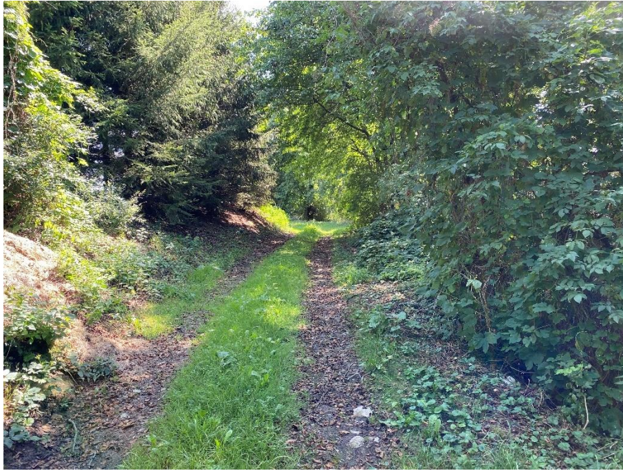
Obrázek 69: Lesní cesta 220745503 směrem Souňov [37]