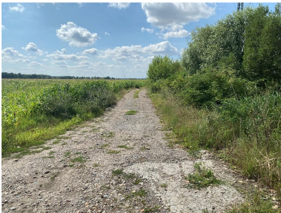
Obrázek 53: Polní cesta 56272033 směrem Kačina [37]