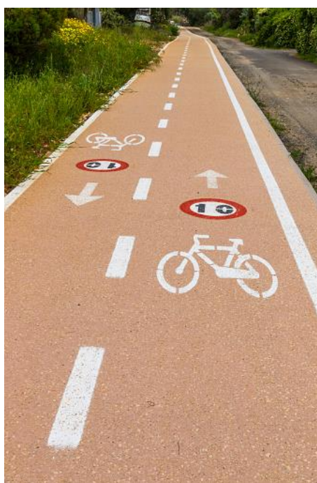
Obrázek 52: Cyklostezka, Sardínie, Itálie [24]