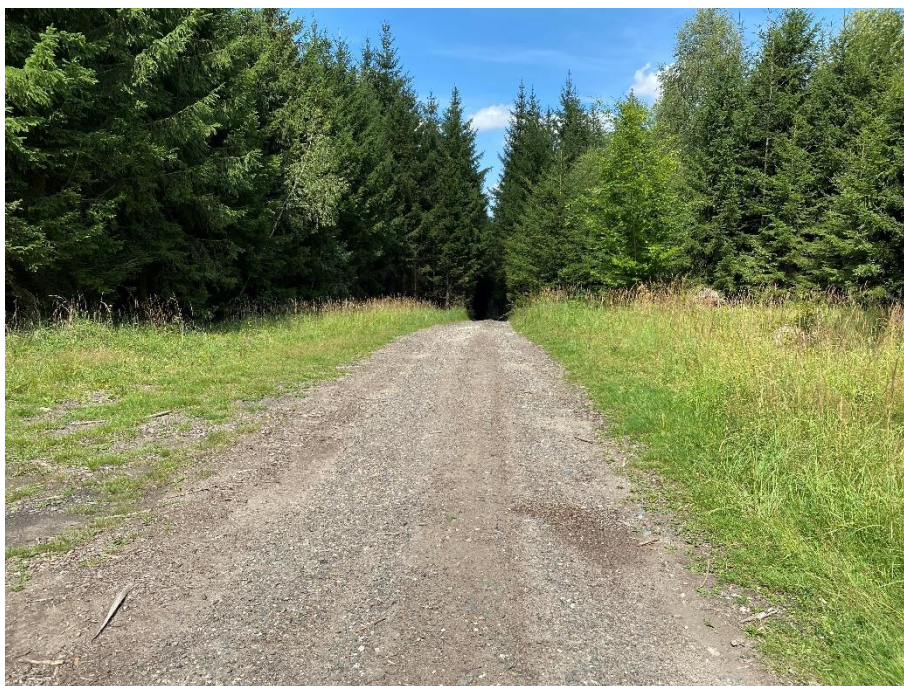
Obrázek 15: Lesní cesta 392596020 směrem Řeplice [37]