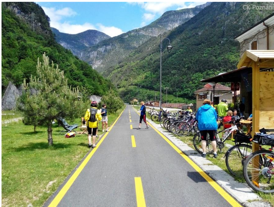
Obrázek 2: Stezka pro cyklisty Alpe Adria [1]