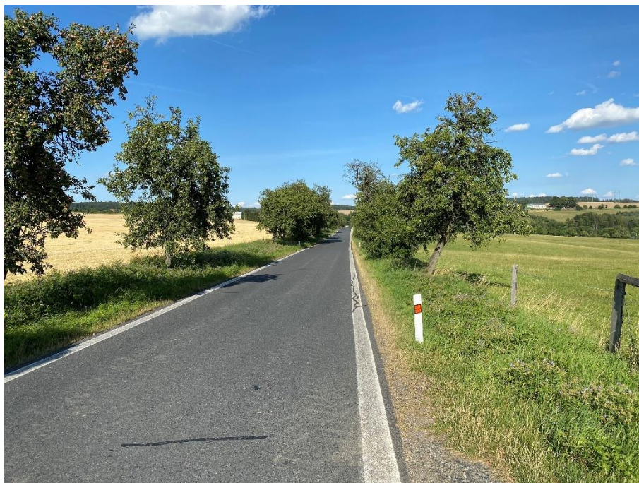
Obrázek 31: Komunikace II/336 směrem Čestín [37]