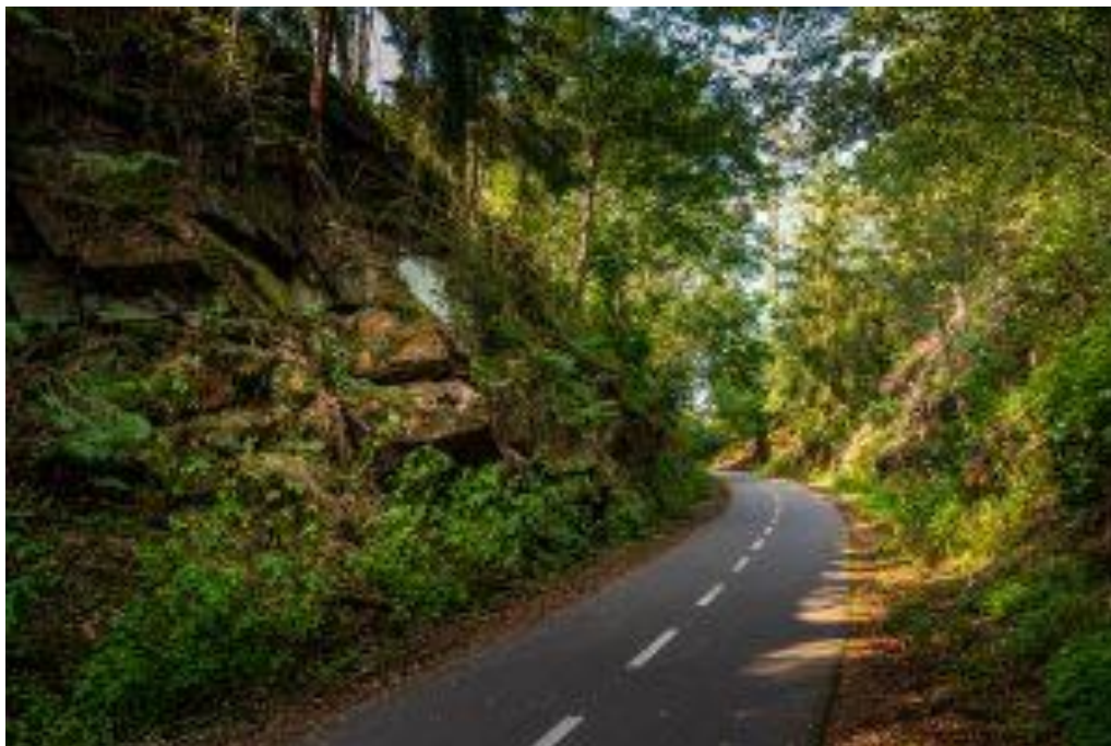
Obrázek 14: Cyklostezka Žďárské vrchy [8]