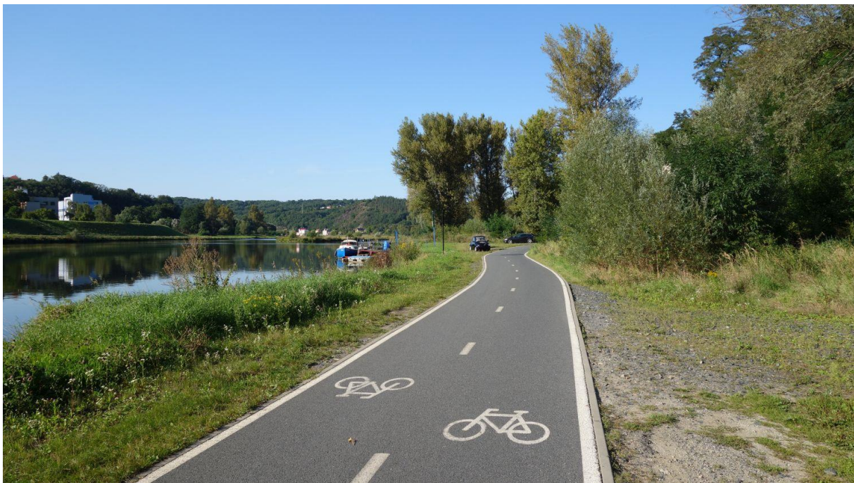
Obrázek 30: Cyklostezka Troja – Klecany [20]