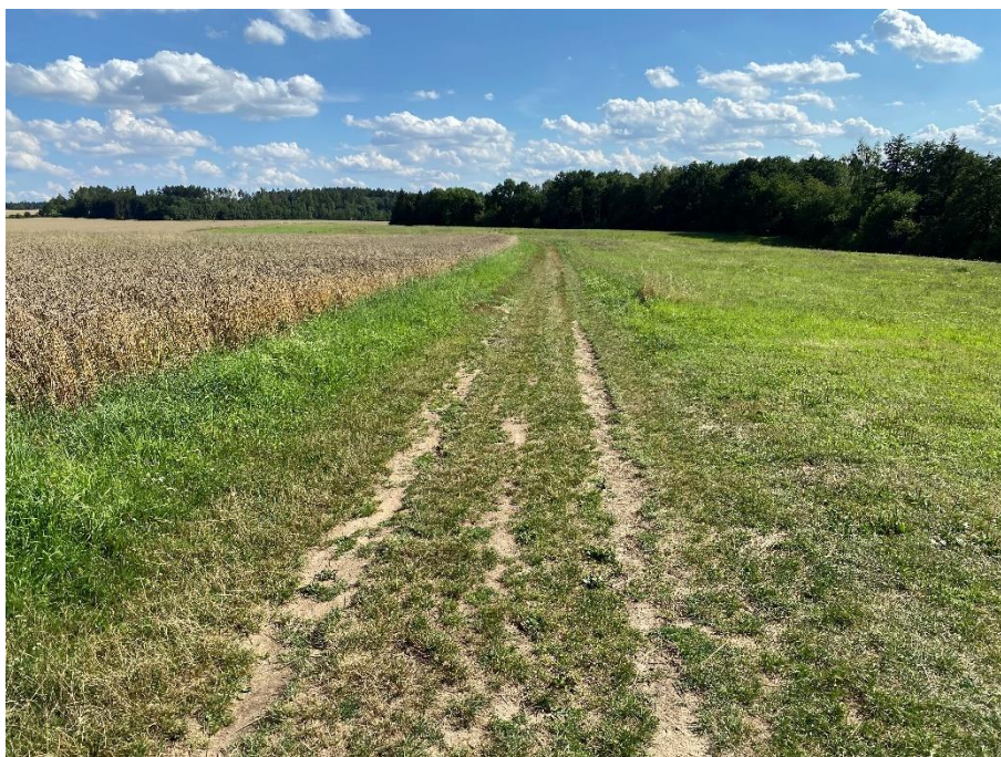
Obrázek 47: Polní cesta 220801906 směrem Staré Nespeřice [37]