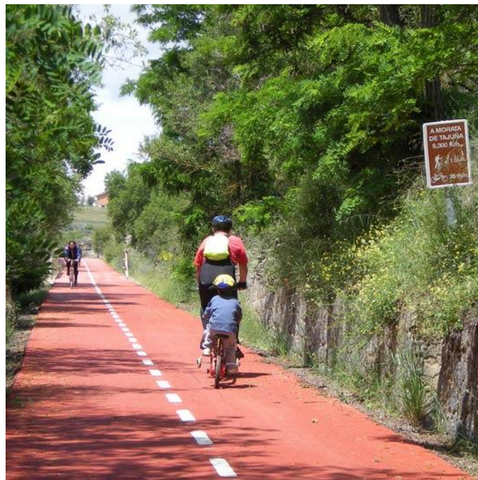
Obrázek 64: Cyklostezka, Španělsko [27]