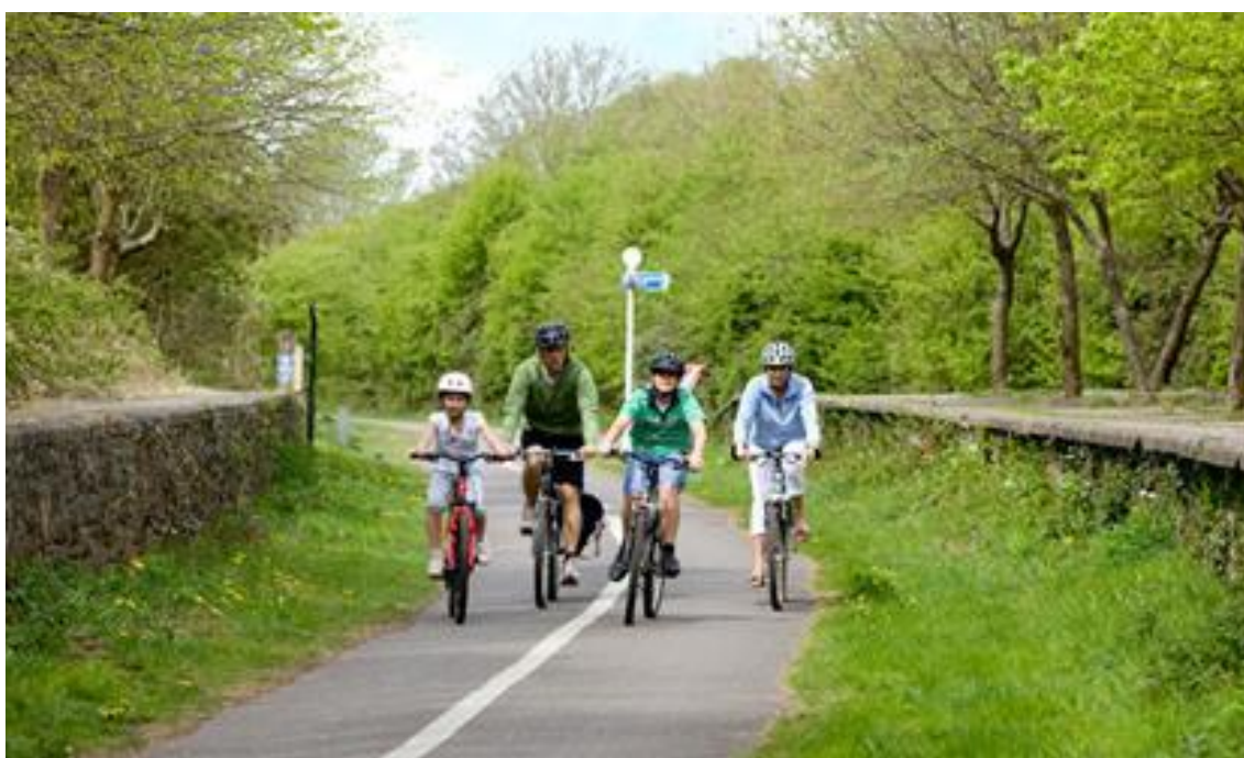
Obrázek 58: Cyklostezka, Bristol, Velká Británie [26]