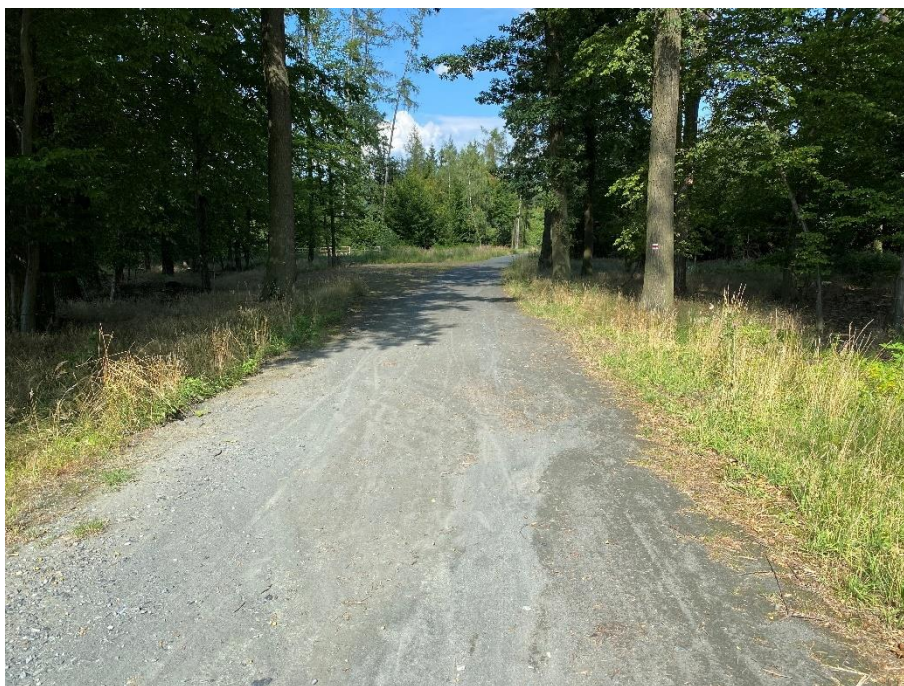
Obrázek 11: Lesní cesta 215614860 směrem Chlístovice [37]