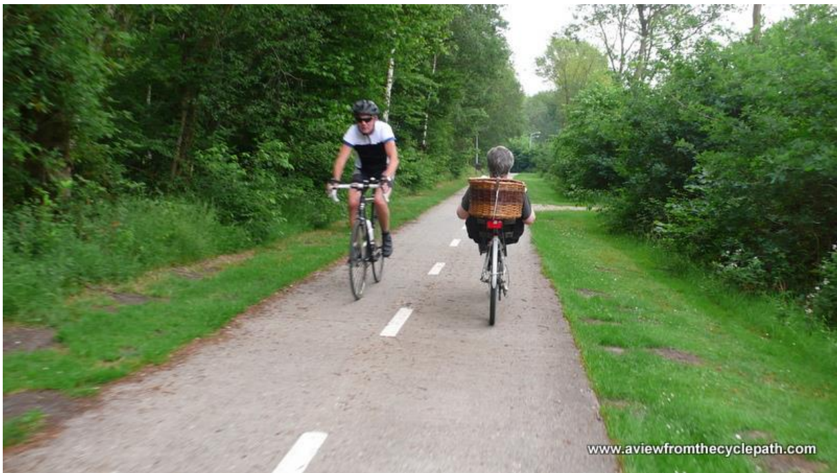
Obrázek 10: Cyklostezka, Nizozemsko [7]