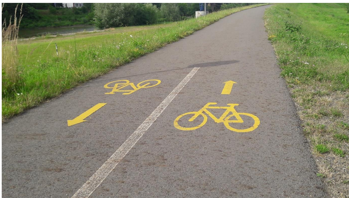
Obrázek 50: Cyklostezka, Valašsko [23]