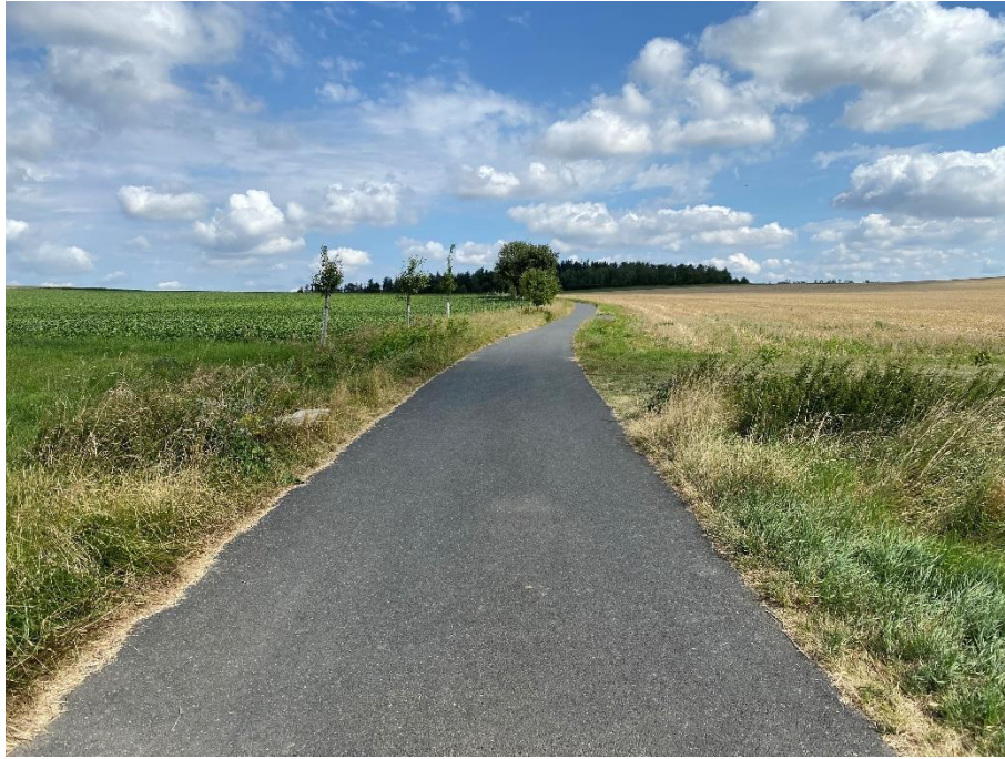
Obrázek 39: Účelová komunikace 320108258 směrem Červené Pečky [37]