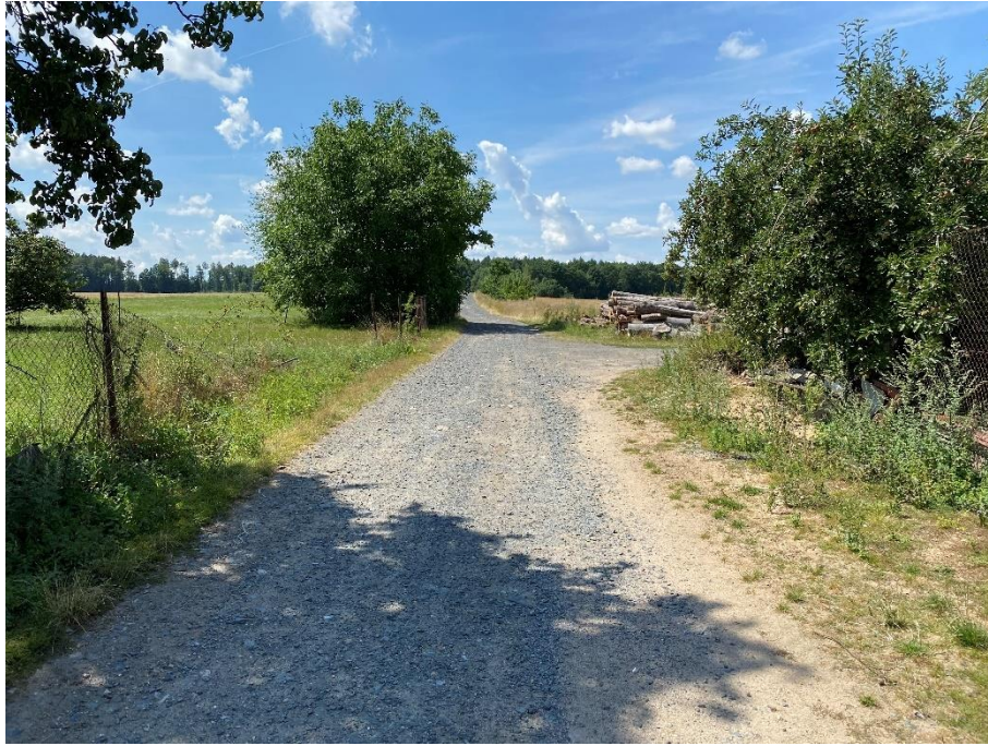
Obrázek 41: Polní cesta 221203344 směrem Paběnice [37]