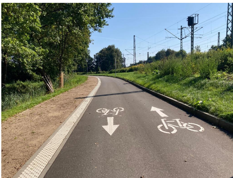
Obrázek 74: Cyklostezka, Hamburg, Německo [31]