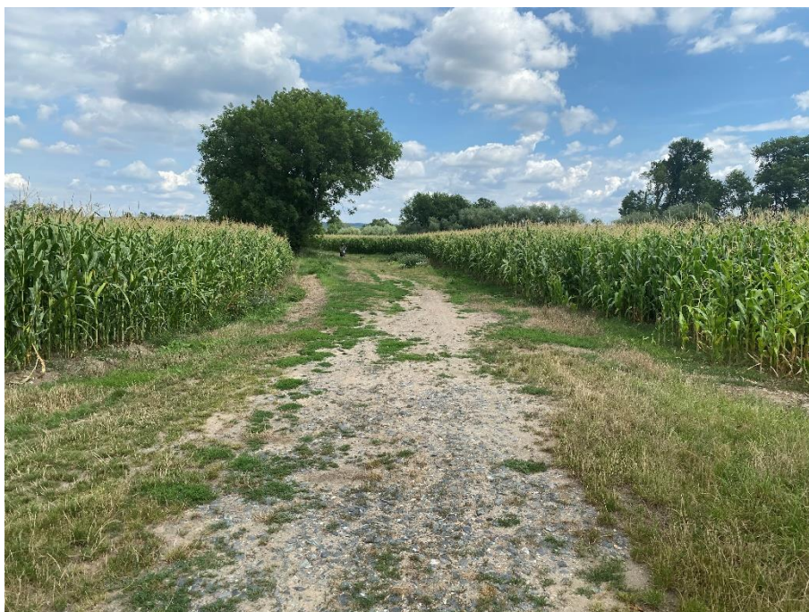
Obrázek 61: Polní cesta 113504773 směrem Zaříčany [37]