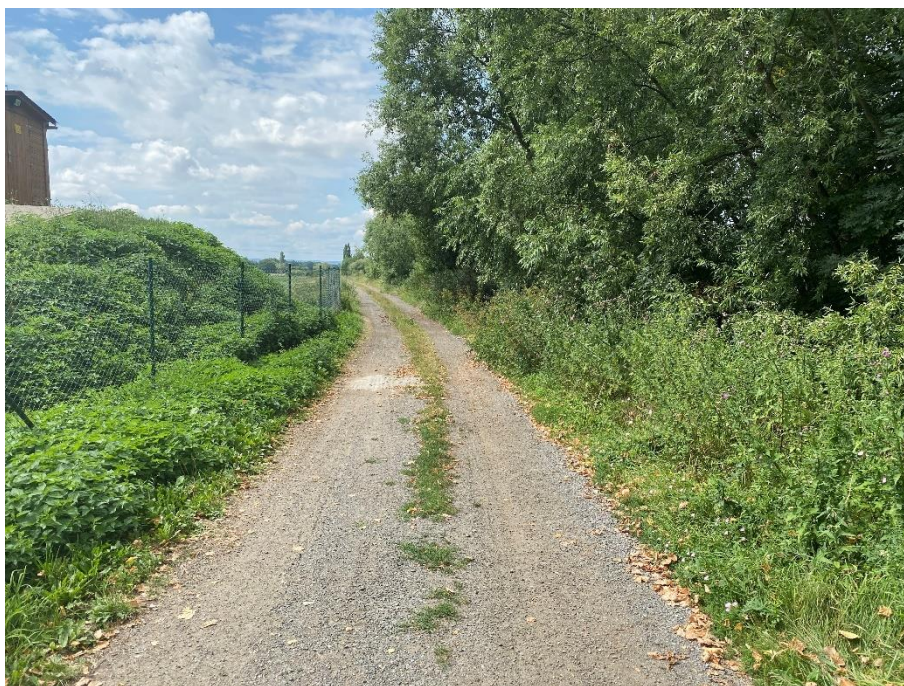
Obrázek 57: Polní cesta 333477321 směrem Žehušice [37]