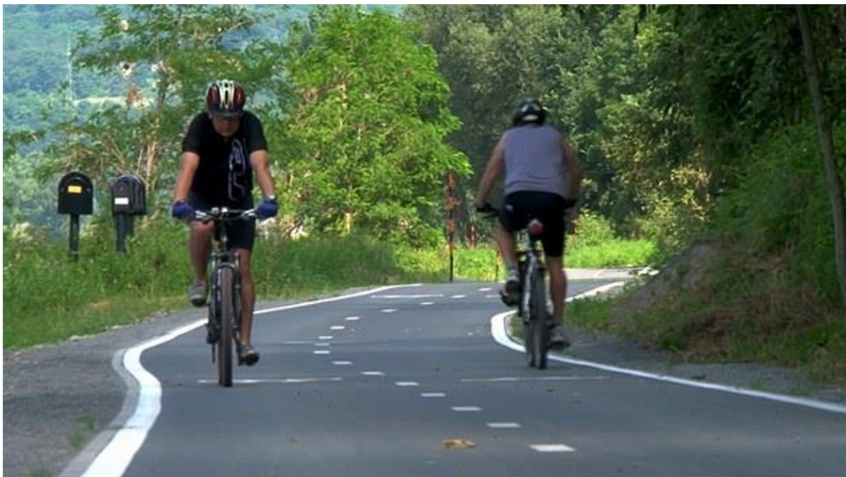
Obrázek 34: Cyklostezka, Sasko [19]