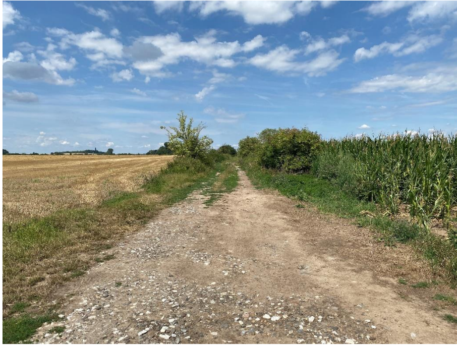
Obrázek 1: Polní cesta 684742700 směrem Horky