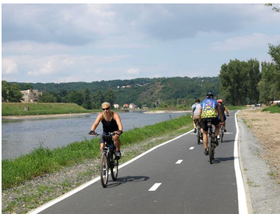
Obrázek 68: Cyklostezka Praha – Klecany [34]