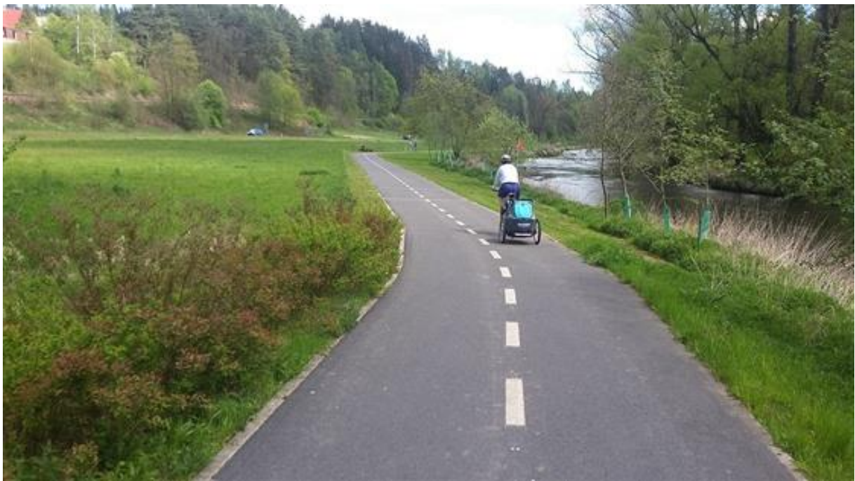
Obrázek 20: Cyklostezka u Ždírcce nad Doubravou [11]