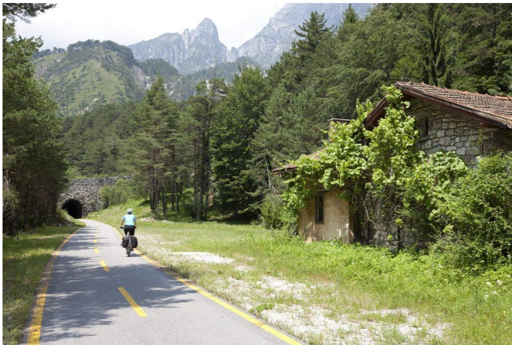
Obrázek 18: Cyklostezka Alpe Adria [10]