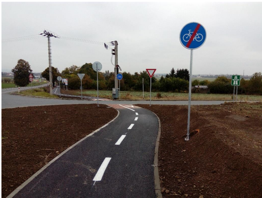
Obrázek 76: Cyklostezka Žešov [33]