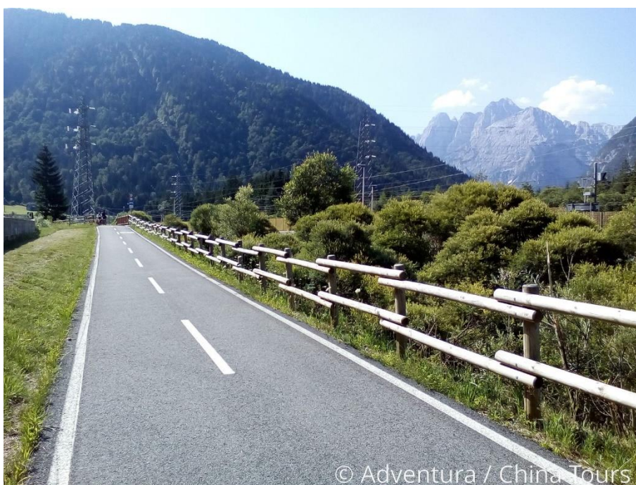
Obrázek 48: Cyklostezka Alpe Adria [22]