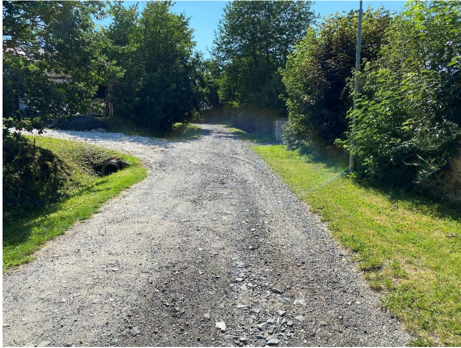
Obrázek 19: Polní cesta 687601753 směrem Rašovice [37]