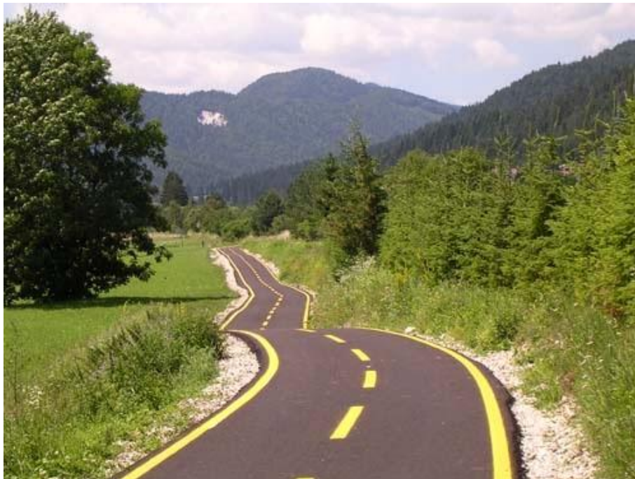
Obrázek 26: Cyklostezka Alpe Adria [12]