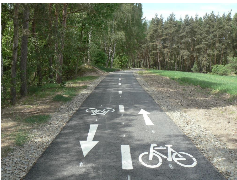
Obrázek 72: Cyklostezka Hlušovice – Černovír [35]