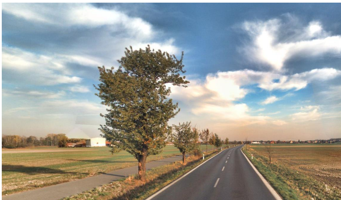
Obrázek 32: Cyklostezka, Kolínsko [37]