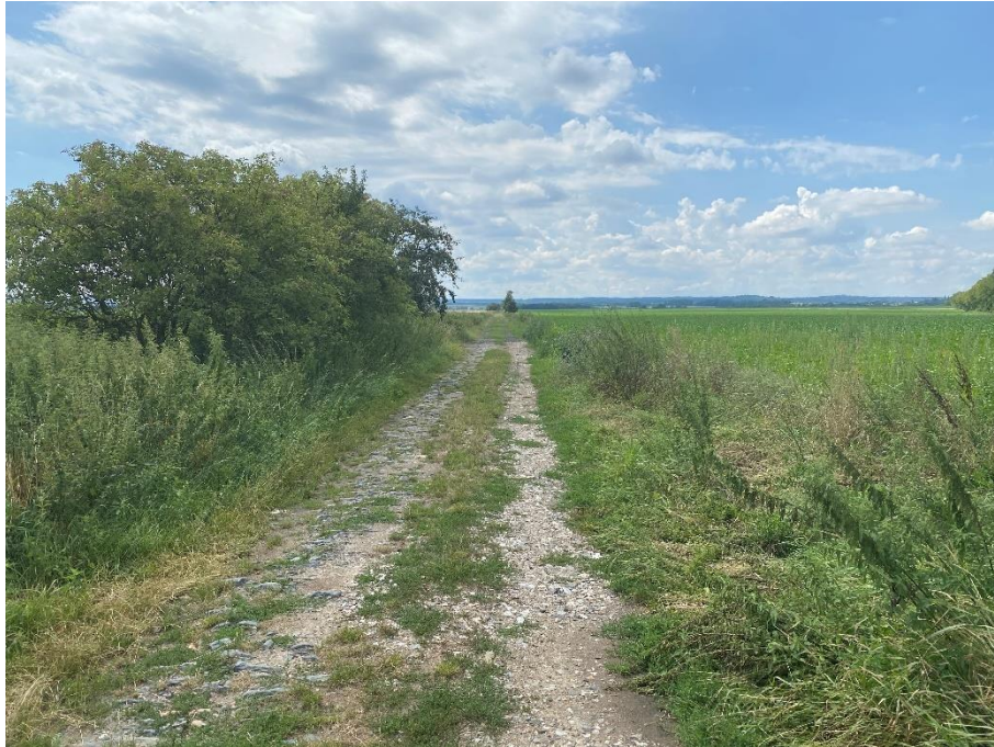
Obrázek 23: Polní cesta 186580098 směrem Hostovlice [37]