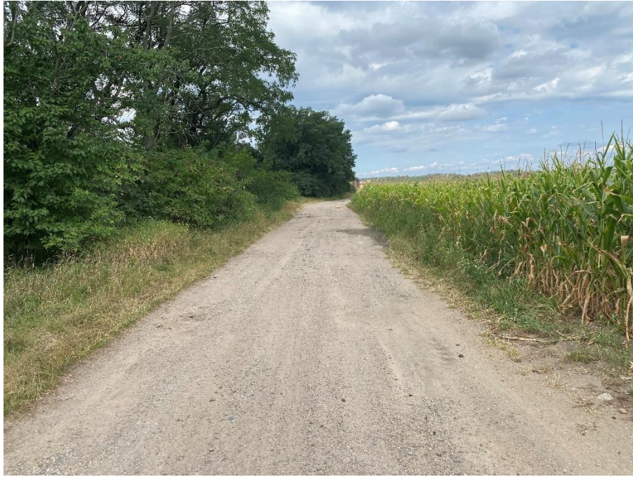
Obrázek 33: Polní cesta 30786253 směrem Starý Kolín [37]