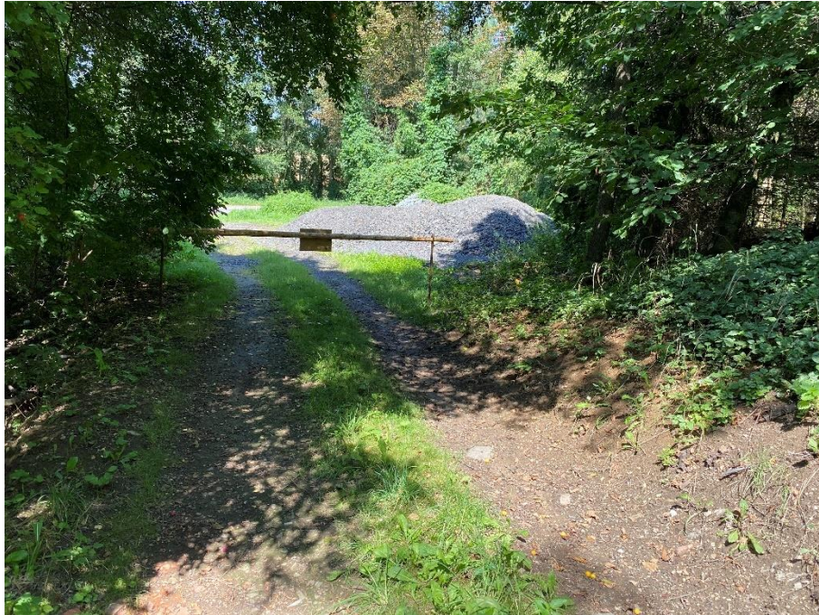
Obrázek 13: Lesní cesta 56021155 směrem Lomeček [37]