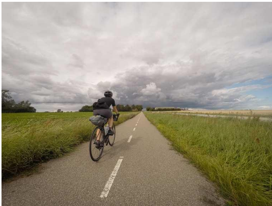
Obrázek 66: Cyklostezka, Dánsko [28]