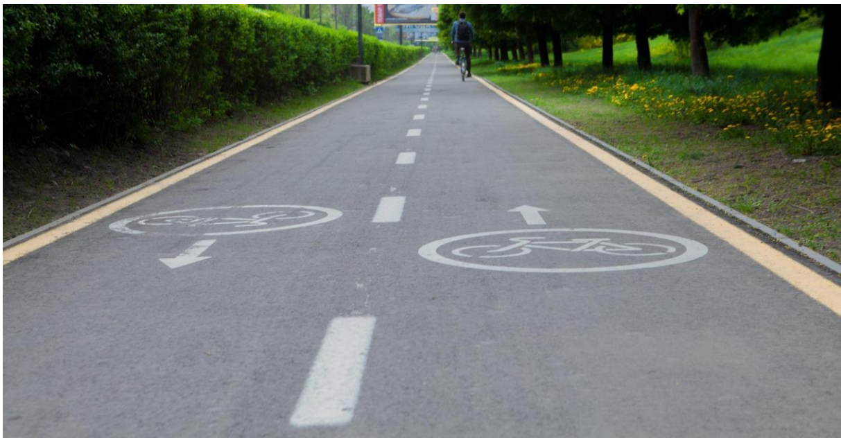
Obrázek 40: Cyklostezka, Ostravsko [21]