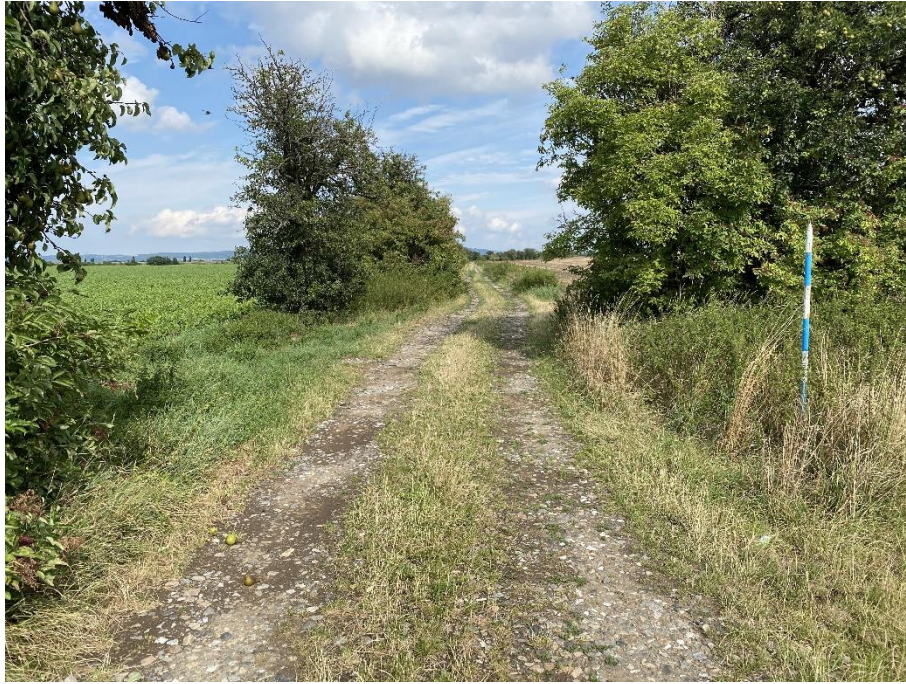
Obrázek 3: Polní cesta 333171361 směrem Horky [37]