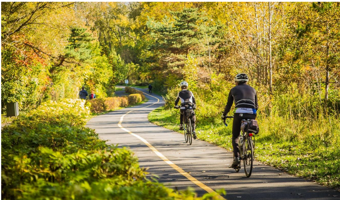
Obrázek 70: Cyklostezka, Montréal, Kanada [30]