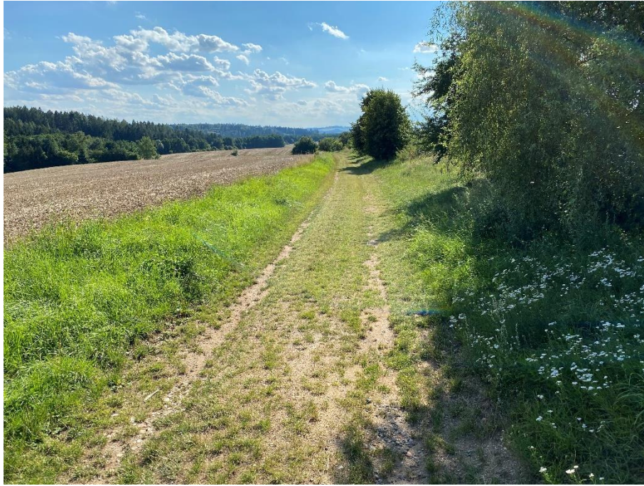
Obrázek 43: Polní cesta 133411826 směrem Rataje nad Sázavou [37]