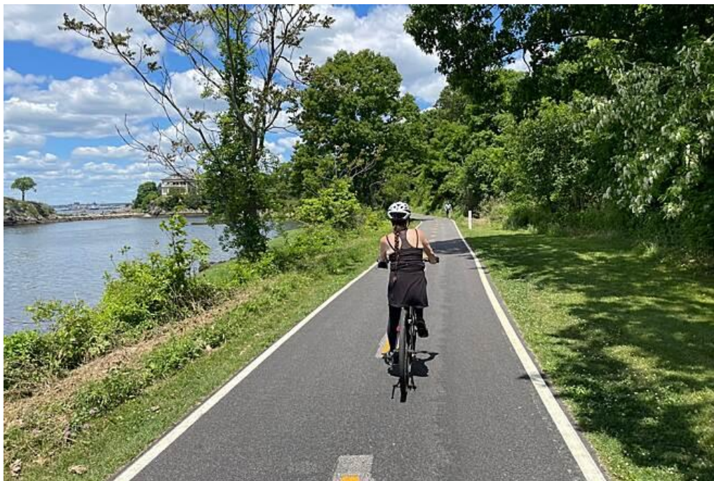
Obrázek 44: East Bay Bike Path, Rhodos, Řecko [4]