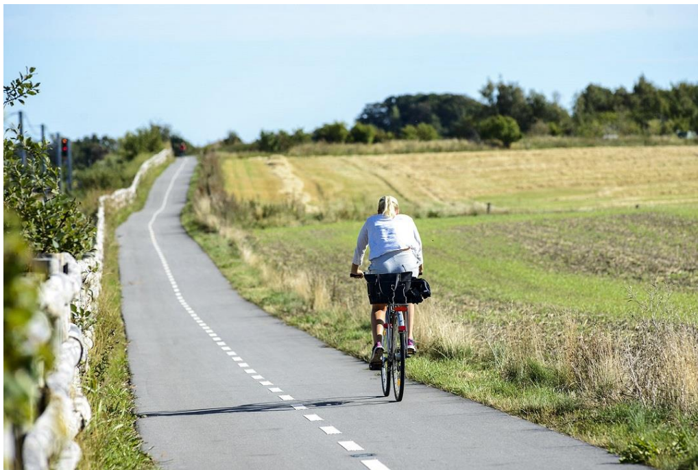
Obrázek 8: Cyklostezka, Dánsko [6]