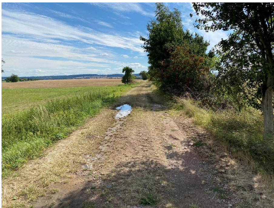
Obrázek 67: Polní cesta 198351830 směrem Nová Lhota [37]