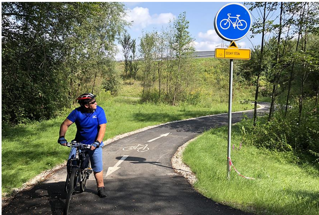
Obrázek 36: Cyklostezka Český Těšín – Ropice [16]