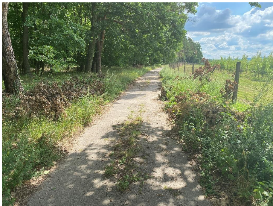
Obrázek 49: Polní cesta 760849741 směrem Semtěš [37]