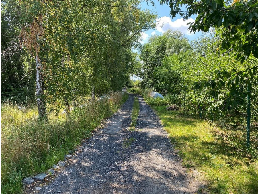
Obrázek 63: Polní cesta 129126639 směrem Paběnice [37]