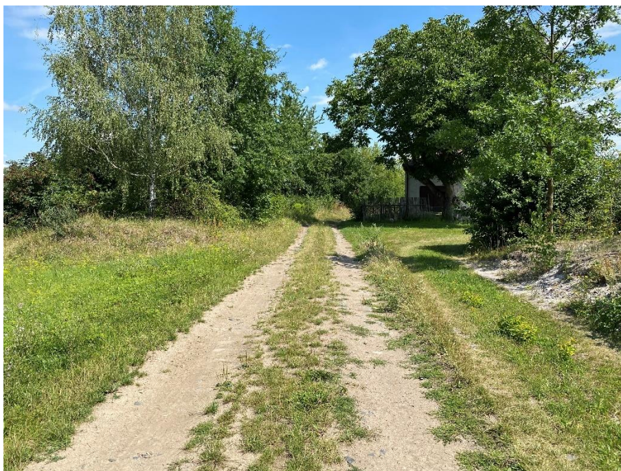
Obrázek 71: Polní cesta 33359614 směrem Čáslav [37]