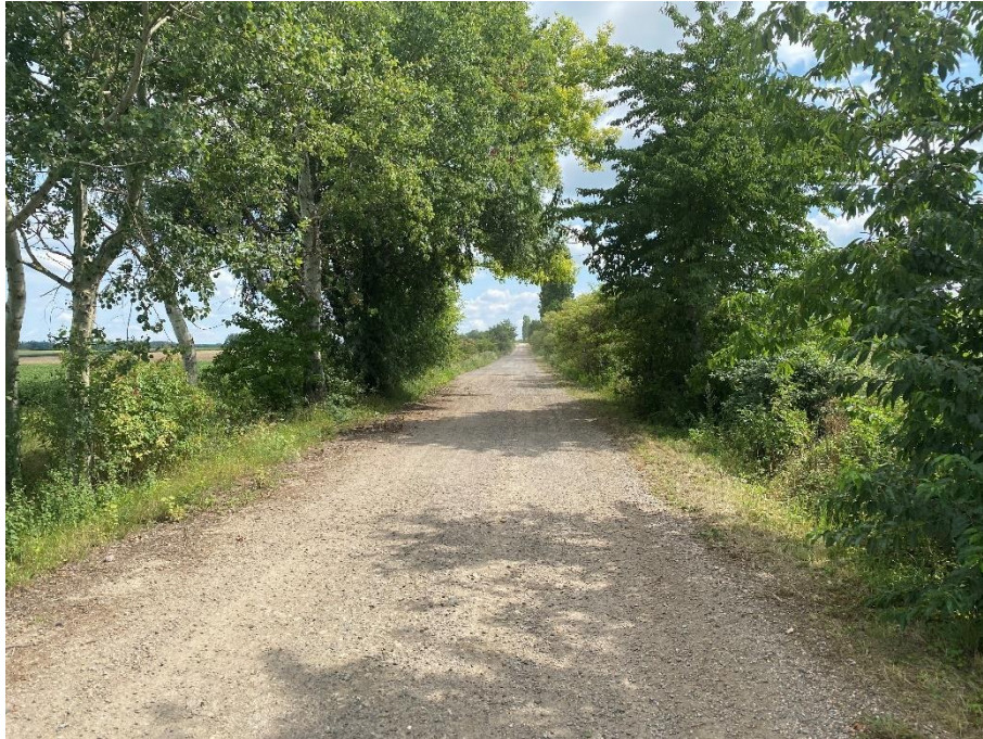
Obrázek 55: Polní cesta 232465137 směrem Církvice [37]