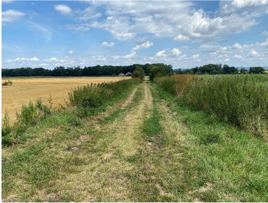
Obrázek 65: Polní cesta 39647894 směrem Vrdy [37]