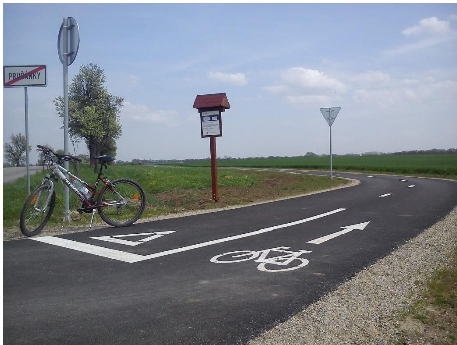
Obrázek 24: Cyklostezka, Prušánky [14]