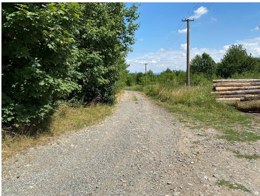
Obrázek 73: Polní cesta 408618319 směrem Čejkovice [37]