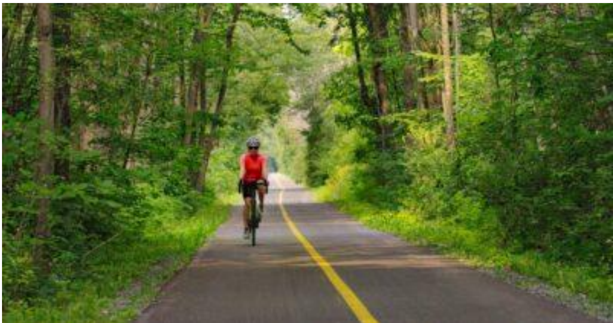
Obrázek 22: Cyklostezka, Montérégie, Kanada [13]