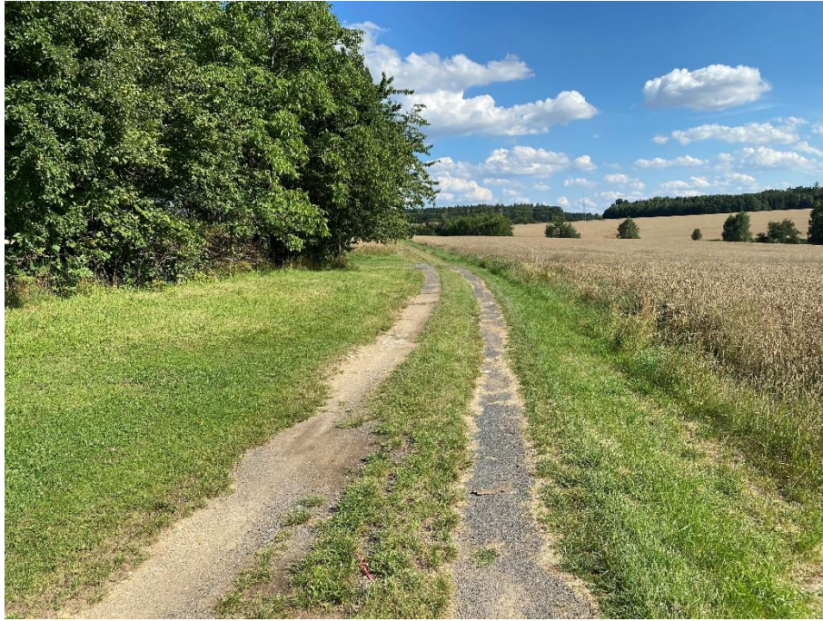
Obrázek 25: Polní cesta 383642898 směrem Malejovice [37]