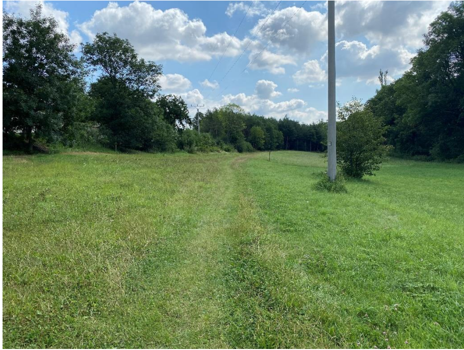
Obrázek 37: Polní cesta 382206184 směrem Přítoky [37]