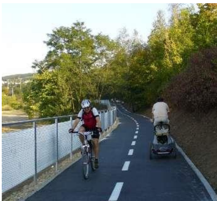
Obrázek 28: Cyklostezka Na Mlejнку – Vrbova [15]