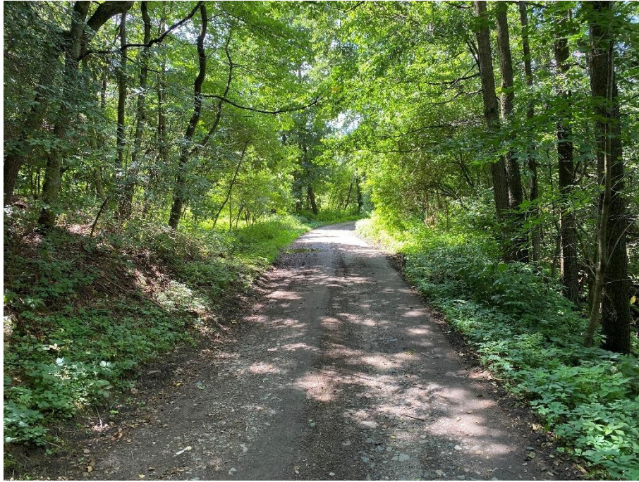
Obrázek 17: Lesní cesta 392612548 směrem Ostrov [37]