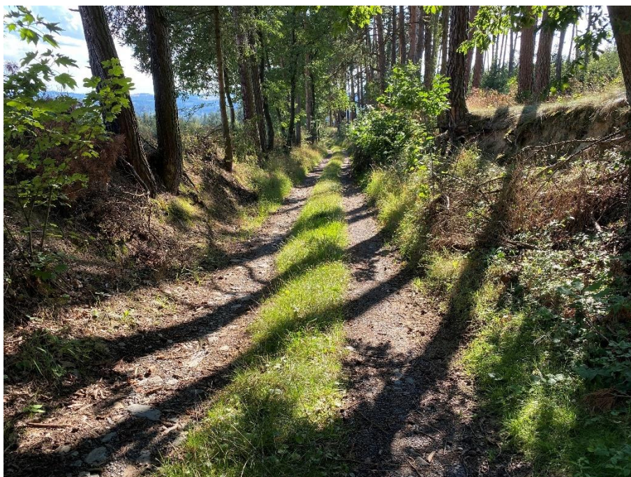
Obrázek 5: Lesní cesta 110606787 směrem Ledečko [37]