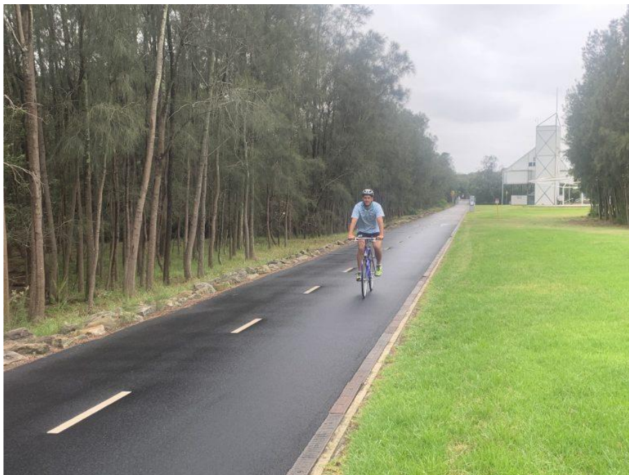
Obrázek 56: Cyklostezka, Austrálie [32]