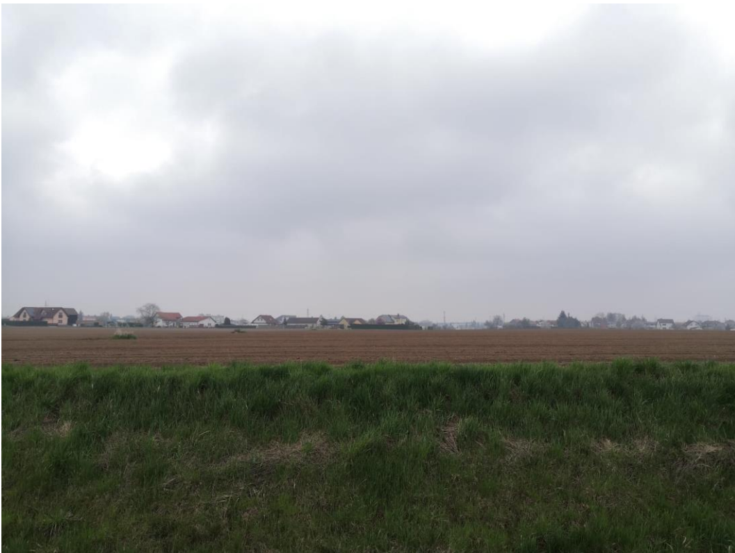
Obr. 4: Pohled ve směru projektovaného ramene okružní křižovatky Hradec Králové