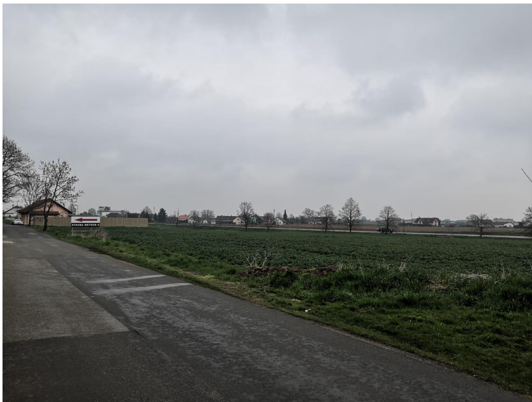
Obr. 5: Pohled na místo uvažovaného připojení místní komunikace v místní části Svobodné Dvory, v pozadí silnice I/11