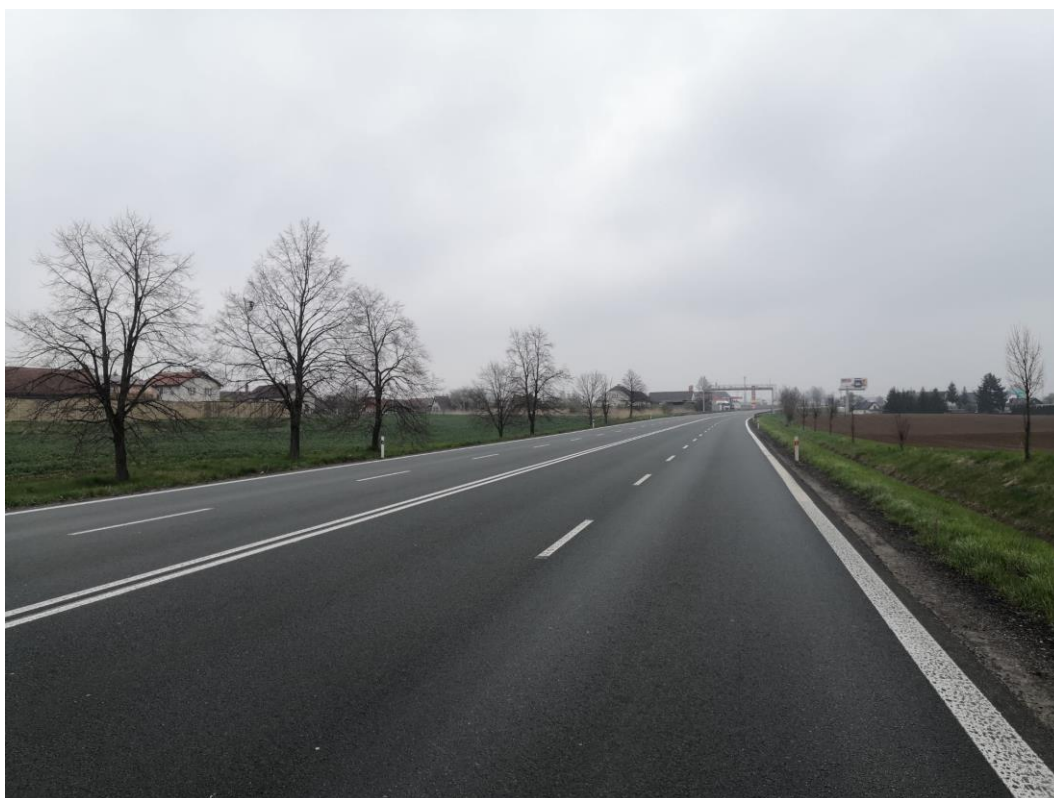
Obr. 1: Stávající silnice I/11 směr Trutnov