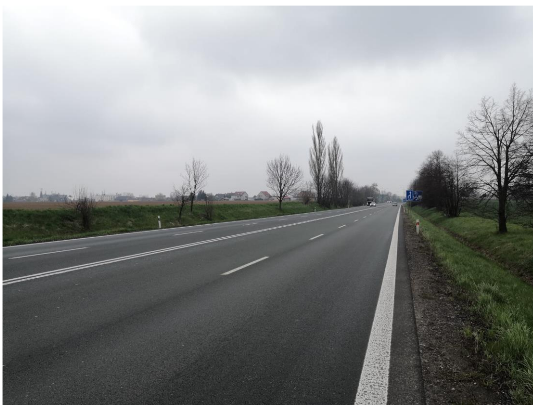
Obr. 2: Stávající silnice I/11 směr Praha