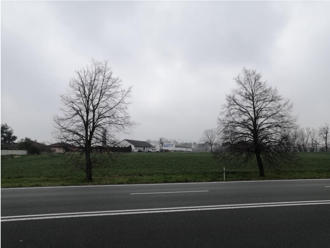
Obr. 3: Pohled ve směru budoucího ramene okružní křižovatky Svobodné Dvory