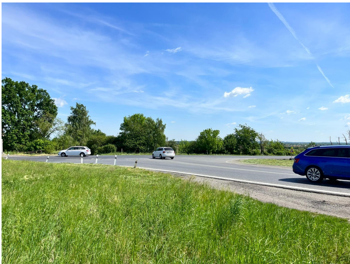
Fotografie 5 Pohled na budoucí MUK, směr Pardubice