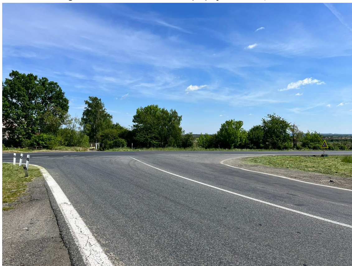
Fotografie 4 Pohled na budoucí okružní křižovatku, MUK