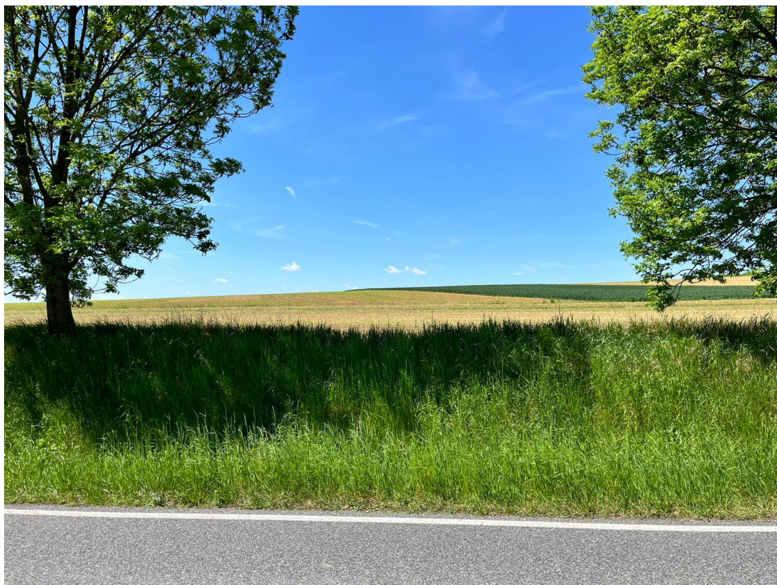
Fotografie 11 Pohled na budoucí vedení doporučené trasy, směr Praha