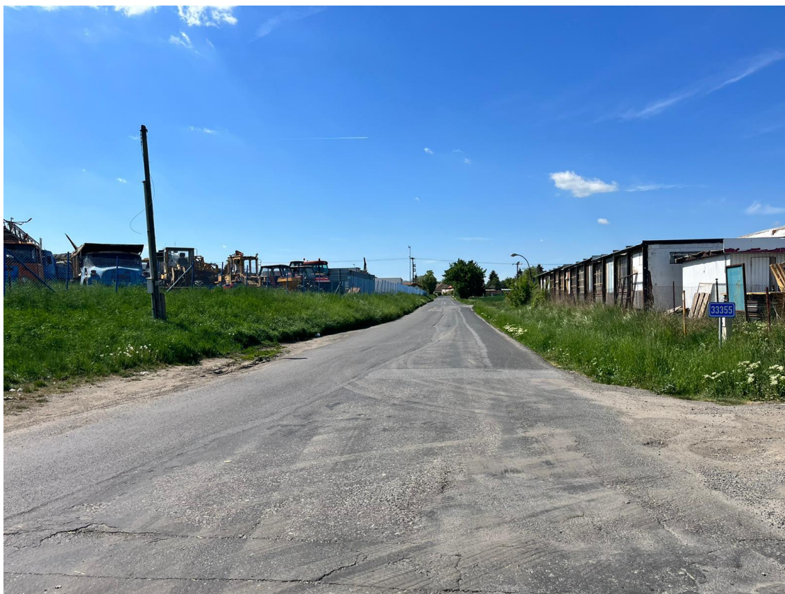
Fotografie 2 Pohled na stávající komunikaci III/33355