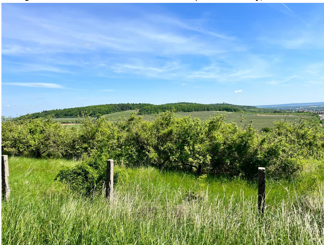
Fotografie 12 Pohled na místo uvažovaného mostu v doporučené variantě