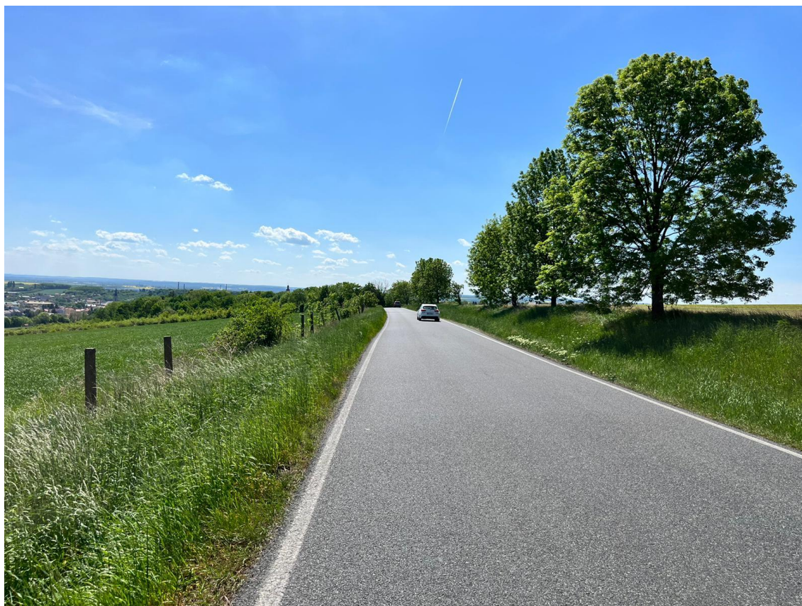
Fotografie 10 Pohled na budoucí místo okružní křižovatky doporučené trasy