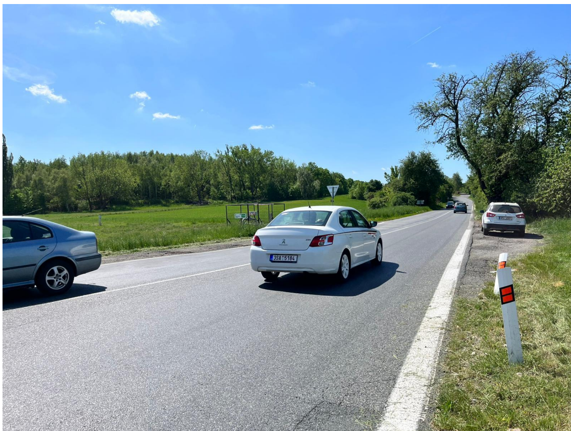
Fotografie 9 Pohled na budoucí MUK, směr Praha