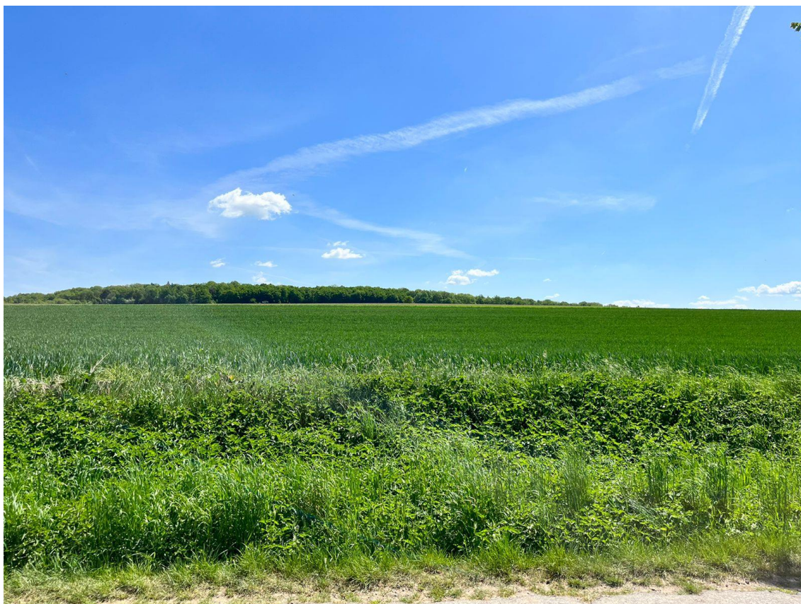
Fotografie 13 Pohled na vedení trasy A, směr Kolín