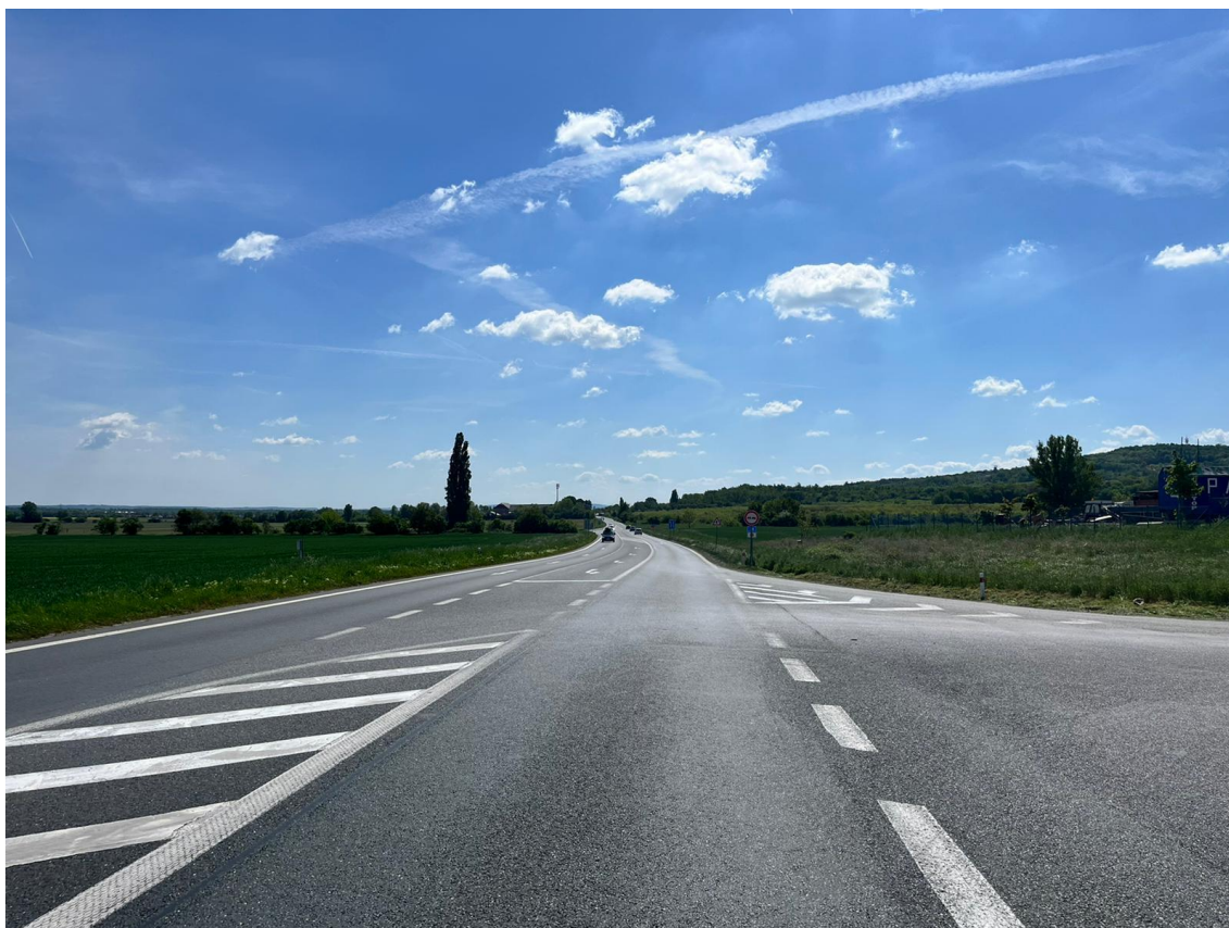
Fotografie 1 Pohled na stávající připojení III/33355 k I/38