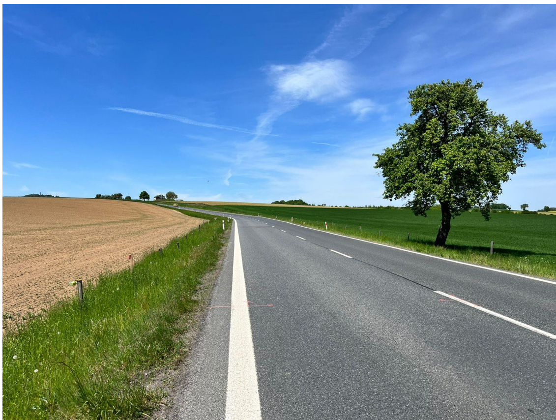
Fotografie 15 Pohled na místo začátku přeložky I/2