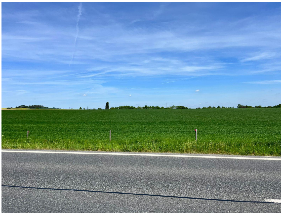
Fotografie 16 Pohled na budoucí stykovou křižovatku doporučené varianty s I/2