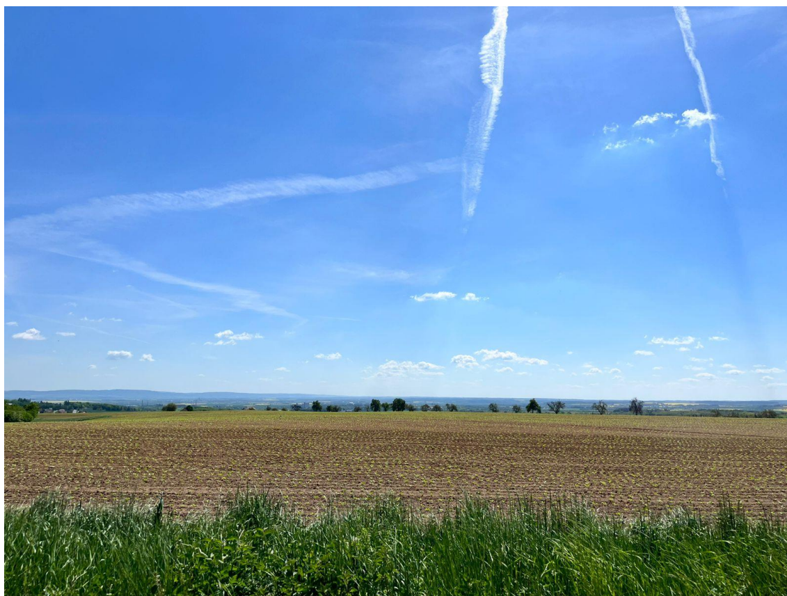
Fotografie 14 Pohled na vedení trasy A, směr Praha