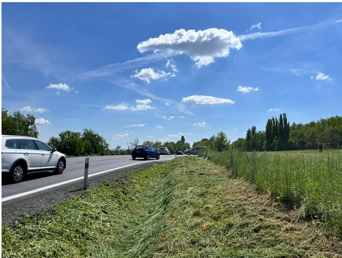
Fotografie 7 Pohled na budoucí MUK – směr Čáslav