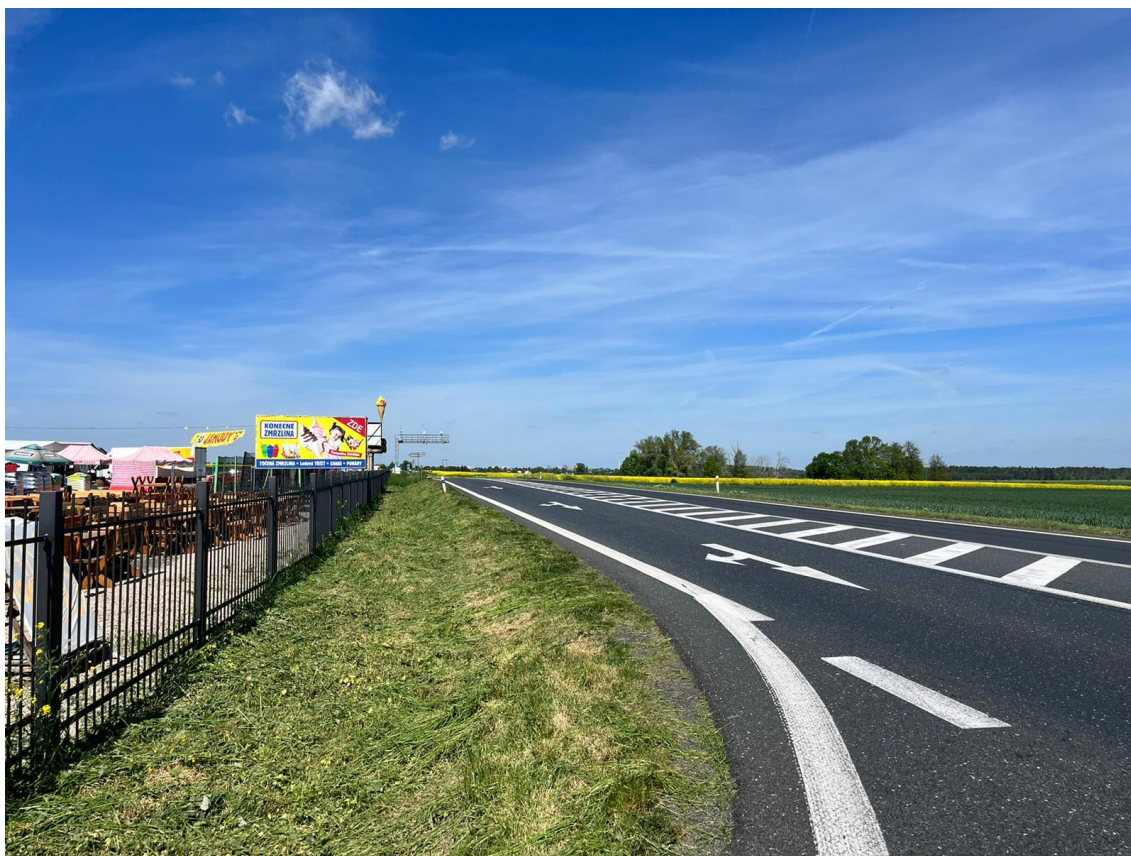
Fotografie 3 Pohled na místo připojení tras A,C k I/38