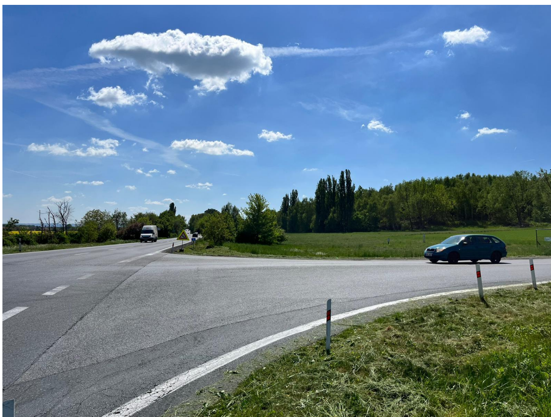
Fotografie 8 Pohled na budoucí připojovací větev MUK, směr Čáslav