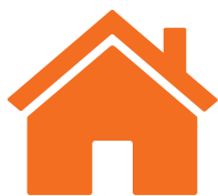
Stavební a technické dozory