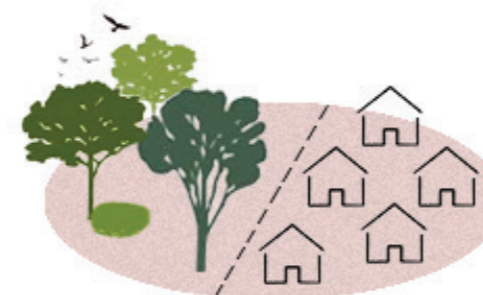
definování hranice města