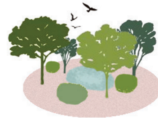
udržitelnost životního prostředí