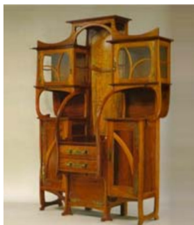
Obr. 13: Secesná ornamentika použitá na nábytku