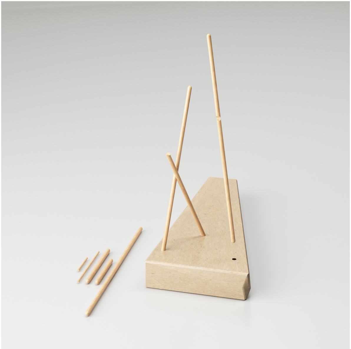
Obr. 41 : Autorská vizualizácia, nemý sluha / balenie + skladanie