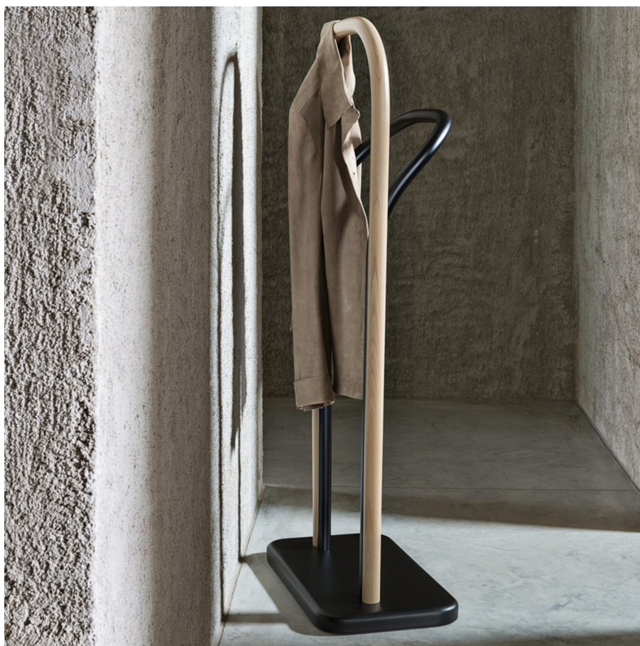
Obr. 16: Arch Clothes Valet, Studio Front, Thonet