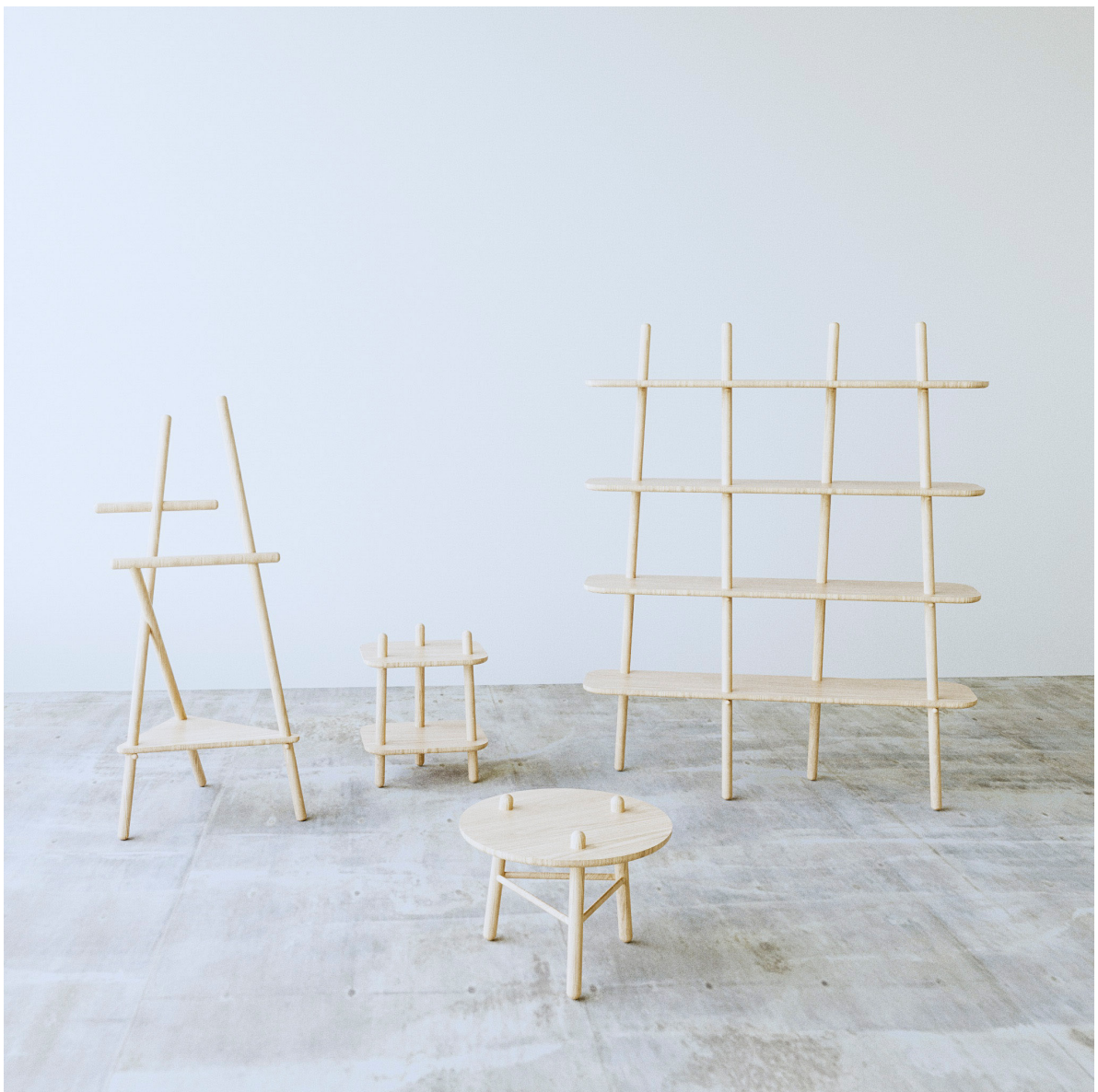
Obr. 35. : Autorská vizualizácia, kolekcia, prvotné idey

Vzniknuté nápady a tvaroslovia som naďalej neustále rozvíjal, hľadal štúdie, porovnával s existujúcimi produktami na trhu a blížil sa k finálnemu návrhu. Okrem dreva som preskúmal i ďalšie možnosti kombinácií materiálu ako bol kov alebo sklo, riešil som vhodnú pozíciu tyčiek a sklon vytvorených uhlov, tak aby bola stále zachovaná estetická stránka produktu, no takisto i potrebná stabilita. Všetky tieto aspekty a procesy formovali tvar až do jeho výsledku, ktorý už bližšie predstavím v nasledujúcej časti práce. Súčasťou procesu bolo vytvorenie veľkého množstva vizualizácií, pokusov a hľadania vhodných tvarových proporcií, ktoré nie je možné z prakt. dôvod všetky priložiť v danej práci.