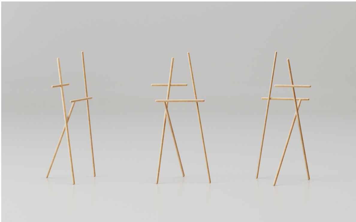
Obr. 23: Autorská vizualizácia, nemý sluha, prvotné tvaroslovie

Takisto priestor na zavesenie košele, saka či iných rozopínateľných kusov odevu má svoje rozmerové pravidlá a pod. Týmto aplikovaním noriem mi vzniklo 5 kusov tyčí z drevenej gulatiny rôznych dĺžok, ktorým som následne začal hľadať vhodnú kompozíciu, ktorá už definovala výsledný tvar. Takouto sofistikovanou kompozíciou v podstate primitívneho spojenia viacerých gulatín vzniklo tvaroslovie. Jednotlivé tyče sú umiestnené v rôznych, špecifických uhľoch v oboch smeroch, na osi x, i na osi z. Tým sa celkový objekt stáva viac priestorovým a z každej strany tvorí v podstate nový tvar, čo splňa parametre solitéru a v priestore, v ktorom bude osadený bude tvoriť výraznú vizuálnu časť interiéru. Svojou kompozíciou a tvarovým obmienením z každej strany vzniká jedinečnosť tohto produktu, ktorý sa tak stáva až akýmsi primitívnym sochárskym dielom s praktickou funkciou.