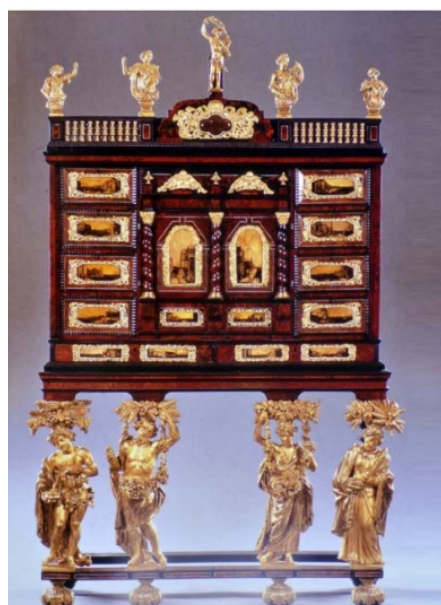
Obr. 10: Kabinet, Antverpy 1670