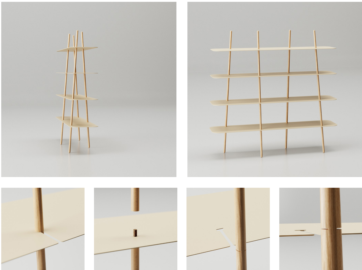
Obr. 24., 25., 26., 27., 28., 29. : Autorská vizualizácia, policový systém, prvotné idey

Po získaní základného, hrubého tvaroslovia nemého sluhu som v nasledujúcej časti prešiel na policový systém. V tomto prípade som už vychádzal už z nájdeného a definovaného tvaroslovia sluhu a snažil sa ho aplikovať i do policového systému. Teda opäť využívam drevené gulatiny, no tento krát v kombinácii s oceľovými policami. Opäť som vo vertikálnych tyčiach aplikoval rôznorodé uhly v oboch osiach, čím sa do objektu dostáva akýsi kúsok asymetrie a priestorovosti a policový systém tak takisto majiteľovi prináša nové tvary z každého uhlu pohľadu. Po nájdení základného tvaroslovia tohto regálu som riešil systém ukotvenia políc a stability, kedy som preskúmal viacero možností. Pre odľahčenie celkového objektu som sa rozhodol odstrániť horizontálne podpery pod policami a nájsť adekvátny spôsob, ktorým by som ich mohol nahradiť.