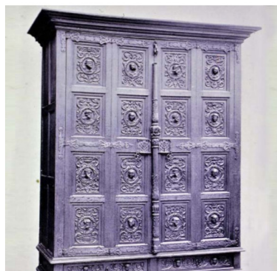
Obr. 08: Skriňa, 16. storočie