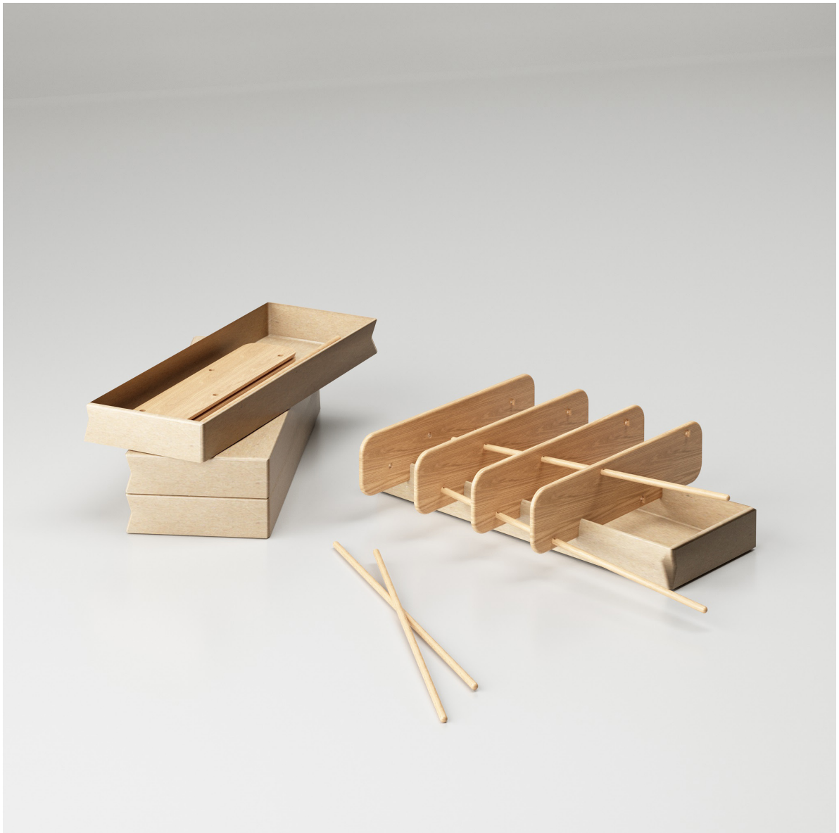
Obr. 44 : Autorská vizualizácia, policový systém / balenie + skladanie