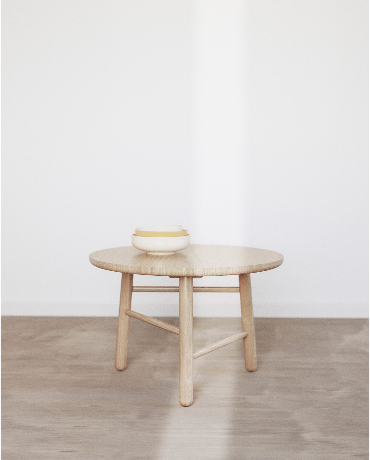
Obr. 47 : Autorská vizualizácia, kávový stolík