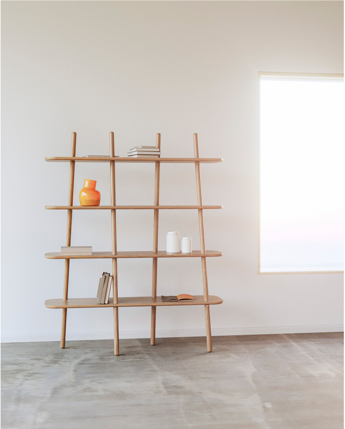
Obr. 45 : Autorská vizualizácia, policový systém