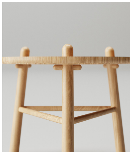
Obr. 30-34. : Autorská vizualizácia, kávový stolík, minibar, prvotné idey