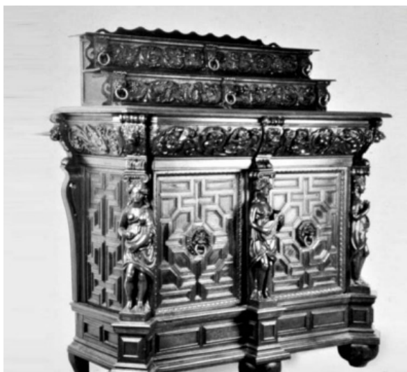
Obr. 07: Renesančný buffet