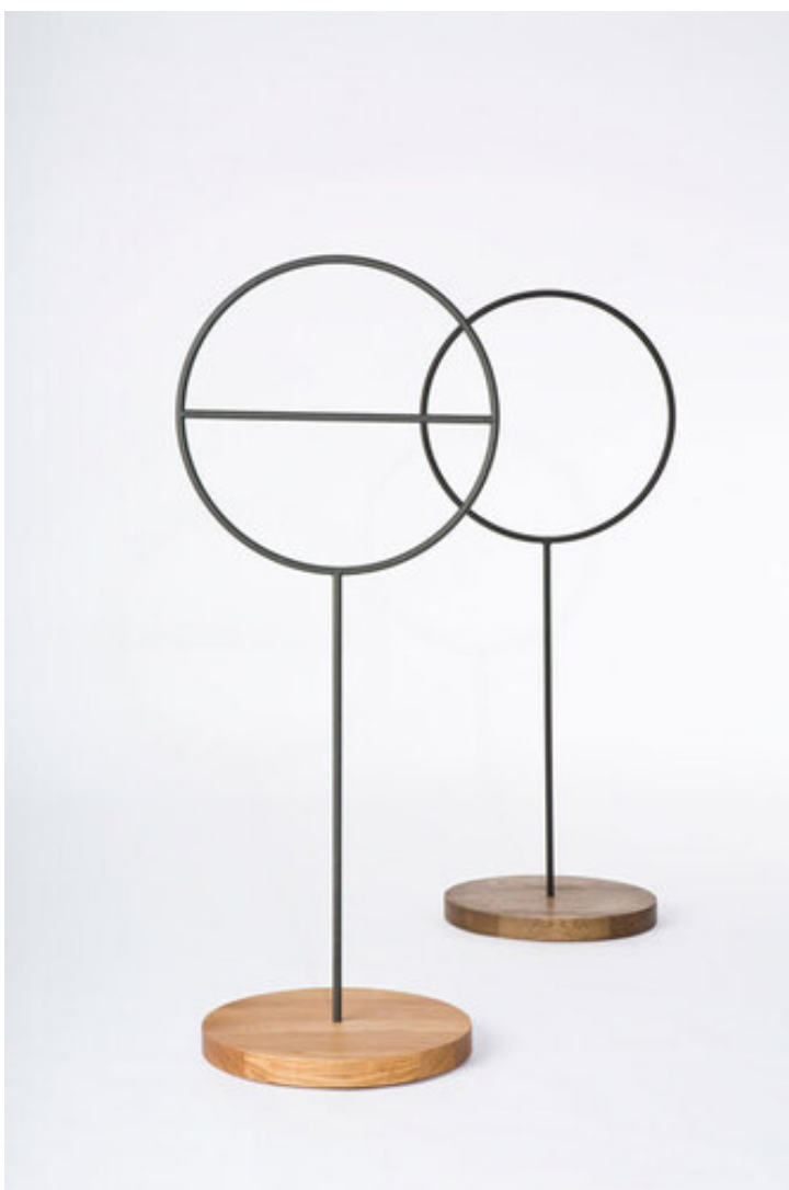
Obr. 18: LIIZO, LLEV