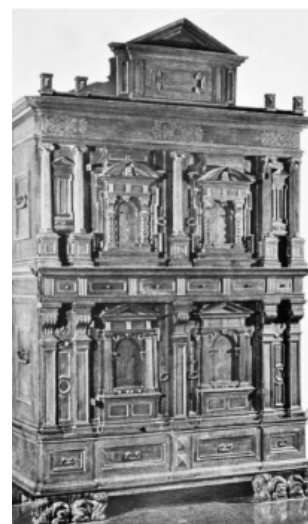
Obr. 06: Architektonicky riešená fasáda skrine