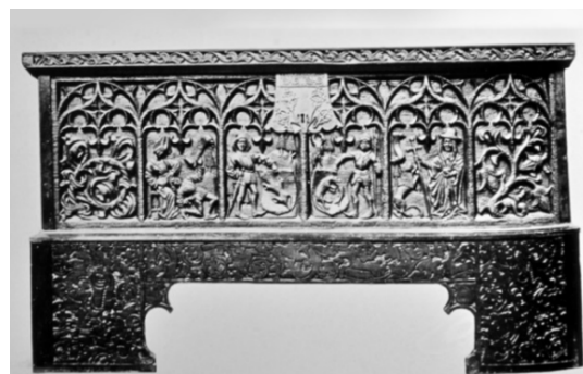
Obr. 04: Truhla z južného Nemecka