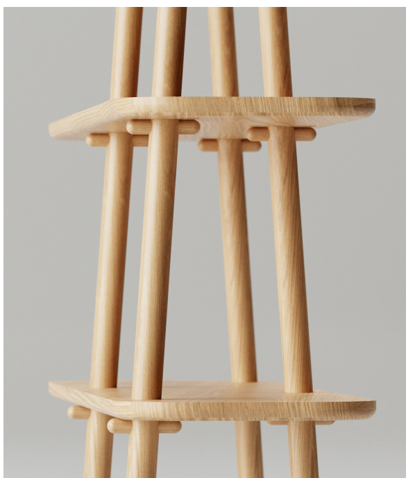
Obr. 43 : Autorská vizualizácia, policový systém + detail