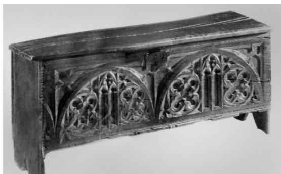
Obr. 03: Gotická dubová truhla

Postupom času pribudli na truhlu nožičky, čím sa truhla v podstate stala akýmsi predchodcom príborníku. Vysoké podnožie podopieralo truhlu s bohatou výzdobou. S podobným typom nábytku sa v gotickom období stretávame prvý krát.