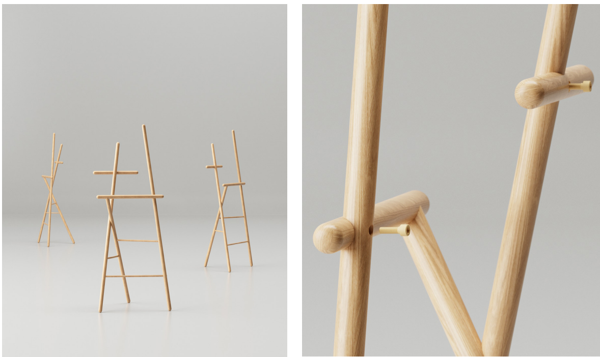
Obr. 40 : Autorská vizualizácia, nemý sluha + detail

Prvým z kolekcie je teda nemý sluha. Vďaka svojemu tvarosloviu a sofistikovanej kompozícii vytvára solitérny objekt interiéru, ktorý svojmu majiteľovi poskytuje priestor na uschovanie akéhokolvek kusu oblečenia. Zadná, horizontálna tyčka vo väčšej výške poskytuje priestor na zavesenie košele, saka a iných rozopínateľných vecí. Nižšia, horizontálna tyčka naopak rieši rôzne prevesovacie textílie a kusy odevu akými sú napríklad nohavice, spodné časti odevov a tričká, mikiny a pod. Najvyššia časť vo forme vertikálnej tyčky zase umožňuje užívateľovi možnosť zavesenia či už odevov dlhších rozmerov, ako je napríklad kabát alebo bunda, alebo takisto i na odloženie si pokrýviek hlavy, ako je klobúk, čiapka a pod. Zvyšné, pretŕčajúce časti gulatiny v horizontálnej rovine tvoria ďalší priestor na zavesenie rôznych doplnkov akým sú tašky, kabelky a iné. Spodné, horizontálne vzpery celkovú konštrukciu nie len spevňujú, ale takisto vytvárajú ďalší priestor na prevesenie napríklad spodného prádla a menších častí oblečenia. Sofistikovaná kompozícia vytvára tak netradičný, veľmi zaujímavý, priestorový objekt, ktorý sa z každej strany prezentuje novým, jedinečným tvaroslovým.