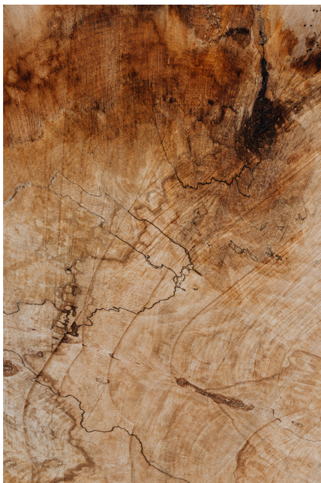
Obr. 22: Drevo

Okrem toho, že ho vieme pomerne jednoducho získať a spracovať, vyznačuje sa i skvelými tepelno-izolačnými vlastnosťami. Ako už bolo spomenuté, jedná sa o obnoviteľný zdroj, ktorý v dnešnej dobe do obrovskej miery dokáže nahradiť rôzne fosílné suroviny a s tým spojené umelé, syntetické výrobky. V porovnaní s takýmto výrobkami je na výrobu produktov z dreva potrebné vynaložiť omnoho menšie množstvo energie, ako na spomínané výrobky z ropy, čím sa automaticky eliminuje záťaž nášho životného prostredia a zredukuje sa využitie chemického opracovania, ktoré takisto do veľkej miery prispieva k znečisťovaniu našej planéty. Predsalen, drevo je nám ako ľuďom najbližšie, takisto celý svoj život pracuje, hnieje a umiera, tak ako aj my. Drevo sa vyznačuje i výbornými estetickými vlastnosťami, jeho netradičná kresba vlákien a pocit tepla vnáša do interiéru akýsi pocit harmónie a kludu. Zvyšné výhody rozoberiem ešte v ďalšej časti práce, kedy už bol jasný konkrétny druh materiálu a dreviny. 20