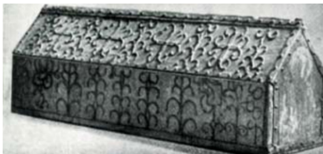
Obr. 01: Románska sadlovitá truhla, 12. storočie

V románskom období opäť neprekvapivo zohrávala dominantnú časť nábytku truhla. V tomto období však boli vyrábané i vďaka rýchlemu presunu. Vplyv architektúry bol silný na celkové estetické vyobrazenia produktov danej doby a aj práve pre to sa na území takmer celej Európy môžeme stretnúť so sedlovými poklopami. Zvyčajne sa líšili len odlišným použitím druhu dreveniny.