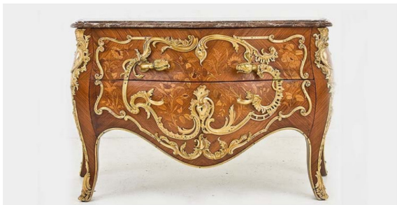
Obr. 11: Bombée

Tá sa začínala prejavovať strácaním na monumentalite a nábytok sa stával viac subtilnejším. V neskoršej fáze sa pridával decentný charakter, ktorý bol príznačný pre danú dobu. Pri rôznych komodách, skriniach alebo stoloch z daného obdobia sa môžeme stretnúť so štíhlimi, vlnitými nohami, ktoré reflektujú dynamickosť a pohyb zvlneného mora. Okrem prírodných motívov boli v trende i orientálne maľby, ktoré zdobili nové exotické drevy ako saténové drevo, či drevo tulipánovníku. Opracovanie a celkové spracovanie nábytku sa čím ďalej tým viac prirodzene stávalo dokonalejším, vďaka čomu začal nábytok pôsobiť naozaj veľkolepo. To si ako to už býva zvykom mohla dovoliť len vyššia vrstva a šľachta, zvyšok si vystačil i s nábytkom bez honosnej dekorácie a jeho funkcia bola výrazne dominantnejšia ako výzor. V rokoku prichádza i nový druh komody, ktorý bol v danej dobe nazývaný ako bombée. To malo výrazne vyduté bočné steny a takisto obsahovalo dve zásuvky. 9