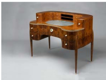
Obr. 12: Stolík so zásuvkami

K rozvoju navrhovania dizajnu v druhej polovici 19. storočia prispeli nové materiály a technológie ako plast, kovové trubky, ohýbanie a pod. Dekór postupne ubúdala a dôraz začal byť kladený na línie objektu.