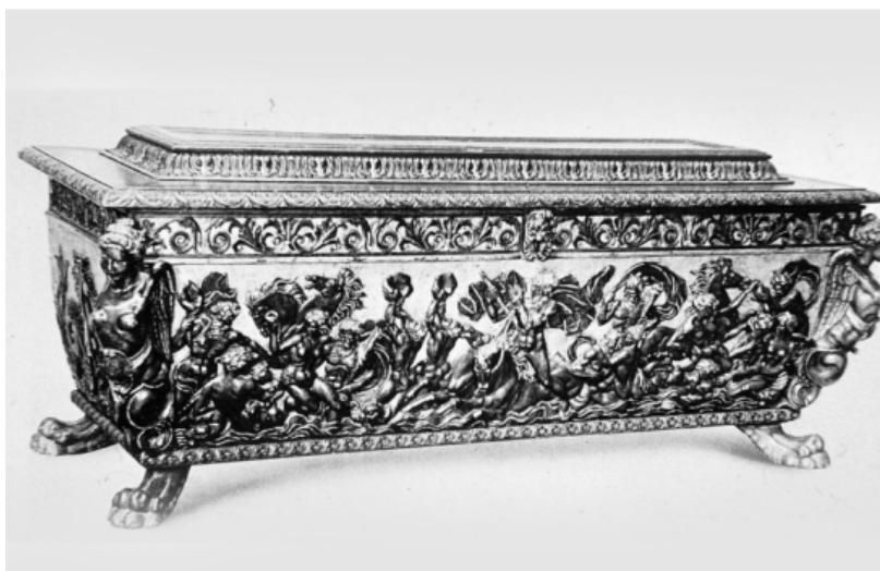
Obr. 05: Truhla z Toskánska.