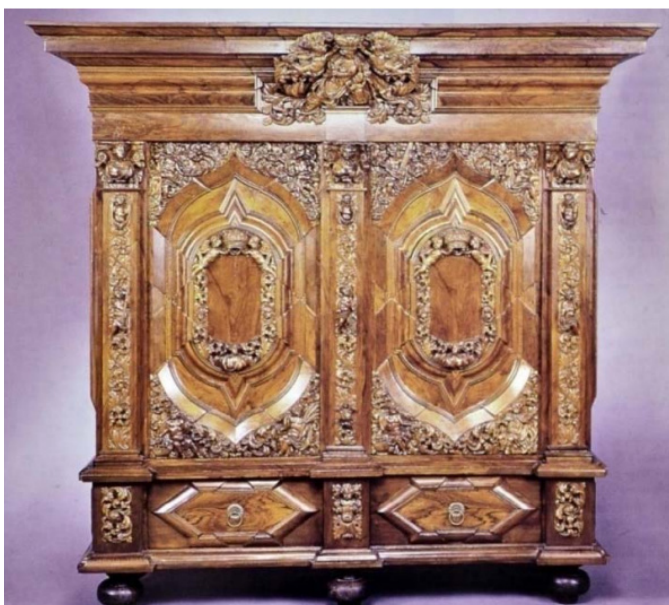
Obr. 09: Hamburgská dvojverová šatňová skriňa

V období približne po tridsať ročnej vojne sa stal nábytok pre vyššiu vrstvu symbolom bohatstva a vkusu, čo sa zobrazilo i na jeho výzore. Drahé kamene, slonovina, rôzne kovania alebo korytnačina doplňovali povrchy z ušľachtilých drevín, ako bol napríklad eben. Opäť silný vplyv architektúry vidíme i na nábytku, kedy vzniká nový typ nábytku vo forme skrine s profilovanou rímsovou. V tejto skrini sa už viac nenachádzali poličky, ale naopak voľný priestor. Vo vrhnej časti bola umiestnená napríklad tyčka, na ktorú sa šaty a oblečenie začalo vešať namiesto skladania do poličiek. 8