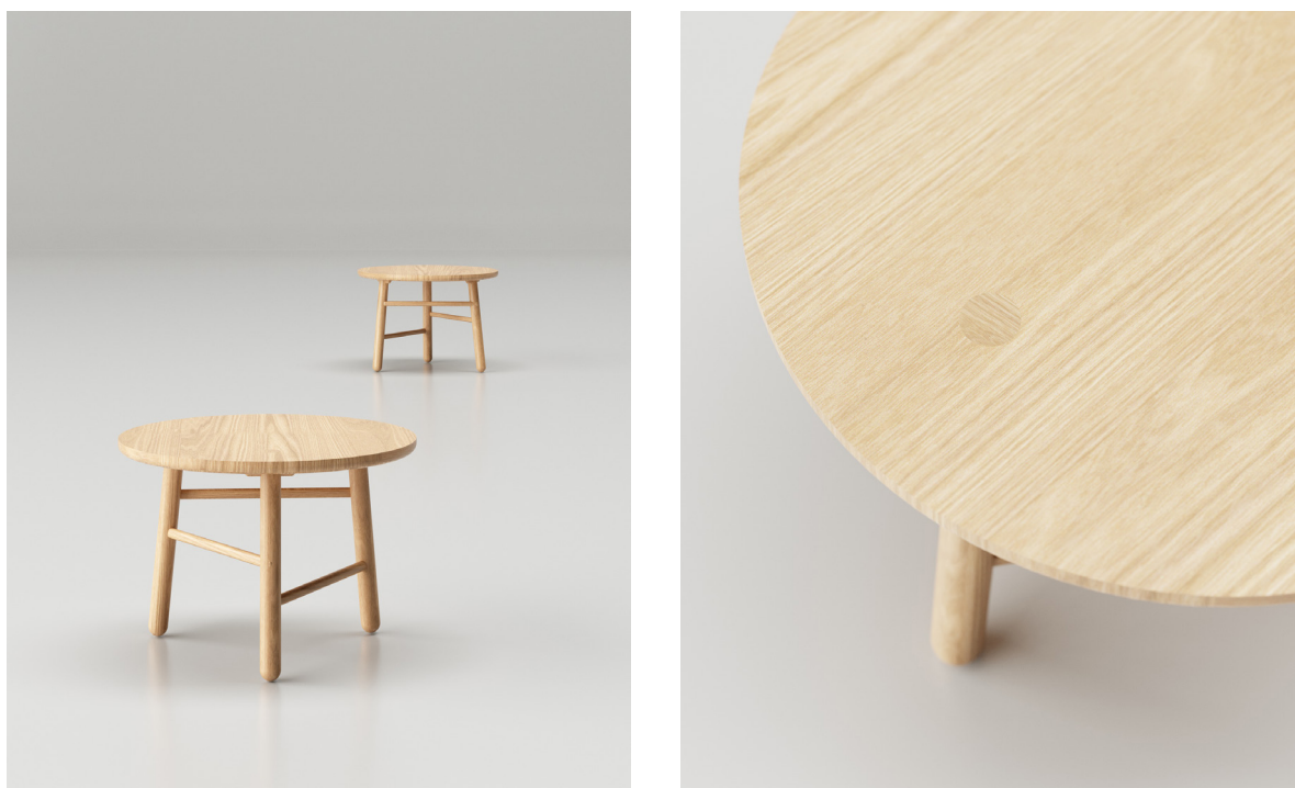
Obr. 46 : Autorská vizualizácia, kávový stolík + detail

Tretím a finálnym produktom z vytvorenej kolekcie je doplnkový objekt, ktorým je konferenčný, respektíve kávový stolík. V tomto prípade sa stále jedná o malý úložný priestor, no môžeme sa skôr baviť o odkladaní ako ukladaní predmetov. Jeho tvaroslavie pragmaticky takisto vychádza zo zvyšku nastavených foriem, tak aby korešpondovalo s celkovou kolekciou. Jedná sa o kruhovitú dosku s priemerom 650 mm, ktorá je ukotvená priznaným priečnym čapom na tri, opäť drevené gulatiny v špecifickom uhle. Tento spoj tvorí príjemný, estetický detail na pohľadovej časti dosky stola. Pre zjemnenie a zachovanie komplementárnosti sú na doske takisto zaoblené hrany. Nosné tyčky sú spevnené horizontálnymi vzperami v rôznych výškach, ako pri nemom sluhovi, čo podporuje myšlienku asymetrickosti, no zároveň ich vodorovné členenie opticky nenaruša pocit čistoty. Stolík takisto ako všetky tri produkty vychádza a rešpektuje antropometrické poznatky, ktoré preddefinovali jeho rozmery a tvarové pomery.