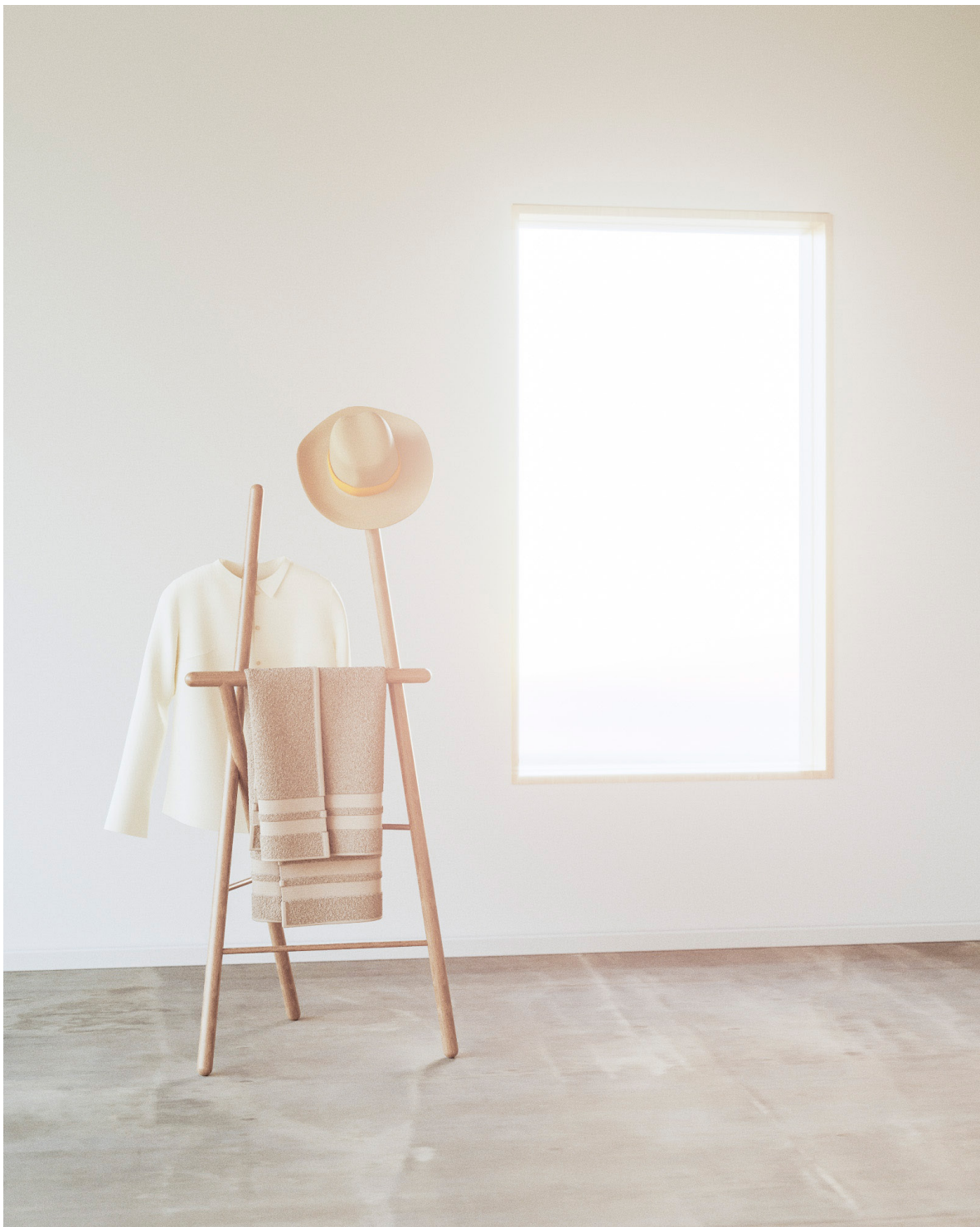
Obr. 42 : Autorská vizualizácia, nemý sluha