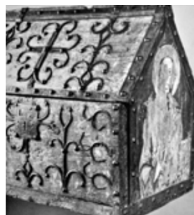
Obr. 02: Detail Malby

Najpoužívanejším materiálom pri tvorbe nábytku v románskom a gotickom období bolo drevo. Medzi úložný nábytok v tomto období radíme i níky, stojany, police, háky alebo bydlá, na ktoré si ľudia odkladali alebo uschovávali predmety každodennej potreby. S primitívnymi policami je spájané najmä kuchynské náradie a predmety, ktoré si potrebovali za účelom rýchlejšieho vysušenia i zavesiť, preto do týchto políc boli často vyrezávané otvory. Podobné police boli využívané i na uschovanie oblečenia. Na výrobe sa mnohokrát podieľalo množstvo remeselníkov a jednotlivé police často zdobili rôznymi malbami v živých, vysoko chromatických odtieňoch, ktoré v danej dobe obľubovala šľachta. Nakoľko mäkké drevo dovoľovalo rytie a vyrezávanie ozdobných motívov, častými prvkami boli preto aj vyrezané mystická fauna a flóra, gotické lomené oblúky, kružba a takisto boli často využívané i figuratívne motívy. Jedným z príkladov je aj vyobrazená gotická truhla z dubového dreva z roku 1500. (obr. 03.) Hrubé dosky sú pospájané perom a drážkou a predná strana je doplnená jednoduchým viečkom so zámkom. Takisto na prednej strane môžeme vidieť zdobenie vyrezávanou kružbou, čo bol veľmi charakteristický ornament danej doby. 6