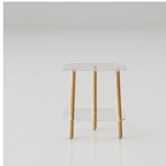
Obr. 36-39. : Autorská vizualizácia, stolík/sklo, sluha+stolík/kov prvotné idey