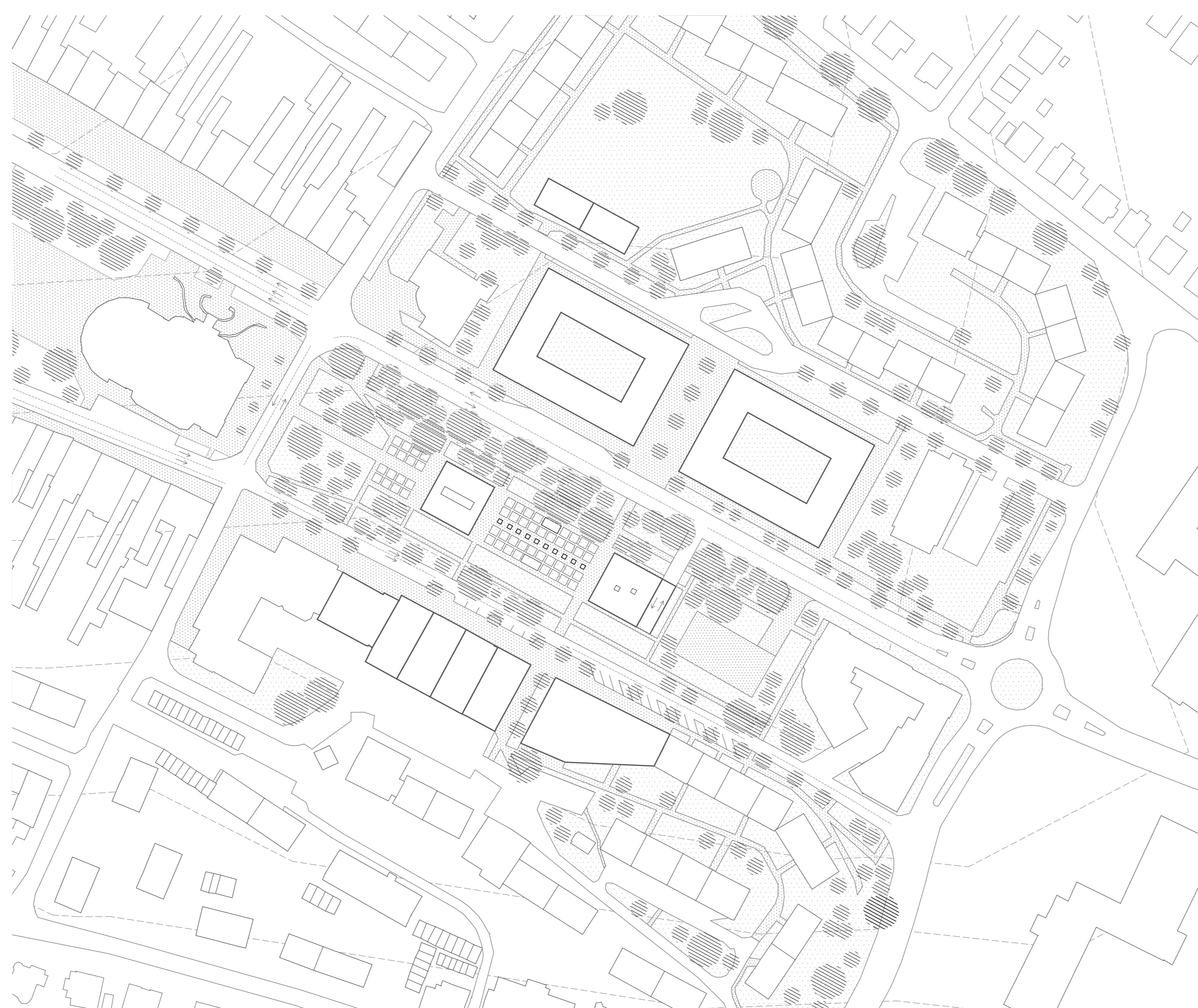
návrhová situácia 100 m

prevádzkové riešenie Knižnica, galéria, spoločenská miestnosť, kaviareň, variabilná sála, parkovisko, trhovisko - to všetko môže fungovať spoločne, ale aj oddelene. Knižný fond Spíšskej knižnice je niečo cez 100 tisíc zväzkov. 3/4 kapacity je vo voľnom výbere v 4. podlažiach, ostatok je uložený v podzemnom archíve. Galéria v 1.NP slúži ako pozvánka k expozíciám nachádzajúcim sa v podzemnom - pre oko okoloideého a pre priamé slnečné lúče - oddelenom podlaží. Zároveň je určená k využitiu všestranných akcií kultúrneho centra. Na podzemnej spojnici knižnice a galérie sa nachádza sála, ktorú môže pre svoje účely využívať ako knižnica, tak aj galéria.