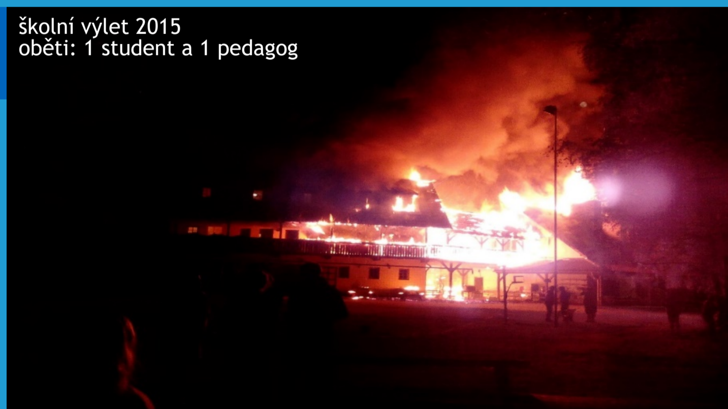
Preventivně výchovná činnost HZS ČR ve školských zařízeních mezi léty 2012 - 2020

školní výlet 2015 oběti: 1 student a 1 pedagog